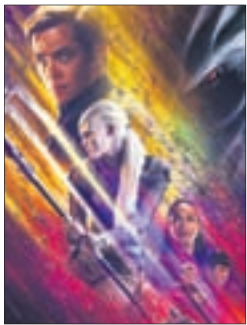
СТАРТРЕК: БЕСКОНЕЧНОСТЬ Фантастика (16+)