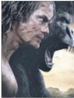
ТАРЗАН. ЛЕГЕНДА Боевик (12+)