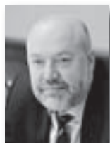
Павел Крашенинников, председатель комитета Госдумы РФ по гражданскому, уголовному, арбитражному и процессуальному законодательству:

Государственные программы поддержки, направленные на сокращение налоговых платежей или даже их временную отмену, снижение административных барьеров, информационную поддержку, создание особых экономических зон и другие меры приносят свои плоды. Предпринимателей становится все больше, все больше людей выбирают бизнес в качестве основного занятия. Это можно, без сомнения, назвать позитивной тенденцией в развитии отечественной экономики».