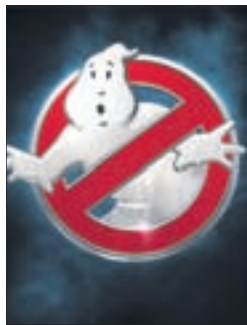
ОХОТНИКИ ЗА ПРИВИДЕНИЯМИ Фантастика (16+)