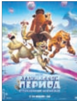
ЛЕДНИКОВЫЙ ПЕРИОД: СТОЛКНОВЕНИЕ НЕИЗБЕЖНО Мультфильм (6+)