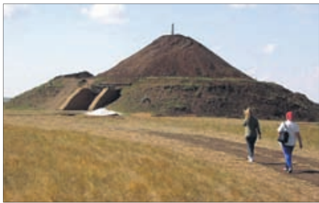
Аркаим — уникальнейший древний городок, который пользуется огромной популярностью среди путешественников.

Магазин горячих туров ул. Ленина, 25, 2 этаж маг. «Кировский» 8 (3439) 27-11-09 8-953-044-5950