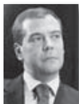
Дмитрий Медведев, председатель Правительства РФ:

По мнению участников, прошедший форум имеет огромное значение – здесь состоялся откровенный разговор между властью и бизнесом. По словам Дмитрия Медведева, еще недавно сложно было представить, чтобы власть и бизнес так легко находили общий язык и так доверяли друг другу. «Мы сумели выстроить диалог, воспринимаем противоположную сторону как союзника, а не конкурента. Это очень важно, поскольку только так можно добиться хороших результатов», – сказал Дмитрий Медведев.