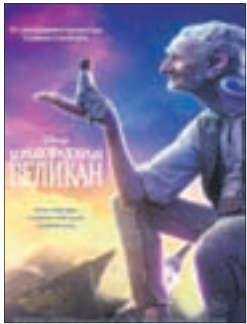
БОЛЬШОЙ И ДОБРЫЙ ВЕЛИКАН Фэнтези (12+)

«Восход» (т. 66-74-45) «Сфера Синема» (т. 29-79-50)