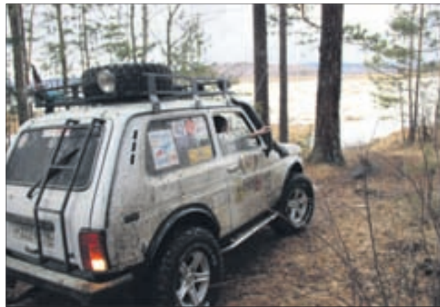
Джипинг не оставит вас равнодушным.

Дата: 16 июля Стоимость: 2.500 рублей с человека