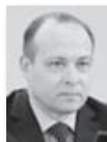
Сергей Пересторонин, министр промышленности и науки Свердловской области:

В рамках этой госпрограммы развития промышленности предприятиям выделяются специальные субсидии. Создаются новые для региона направления промышленности – например, авиационное».