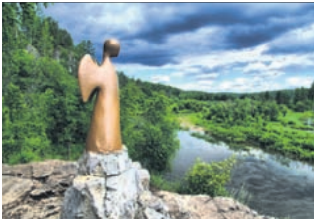
Скульптура Ангела Единой надежды в парке «Оленьи ручьи».

Отправление из Екатеринбурга Дата: 8-10 июля Стоимость: от 6300 руб. с человека В стоимость входит: Услуги гида — экскурсовода и экскурсионная программа в Аркаиме; Переезд на удобном автобусе для дальних рейсов; Питание (1 завтрак, 2 обеда, 2 ужина); Проживание; Входные билеты.