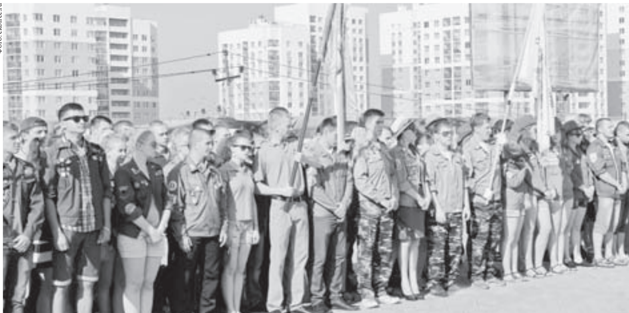
По данным статистики, с начала 2016 года в Свердловской области сдано в эксплуатацию более 600 тысяч квадратных метров жилья. Более 95% стройматериалов производится на территории региона. На фото: стройотряды активно участвуют в строительстве жилья.