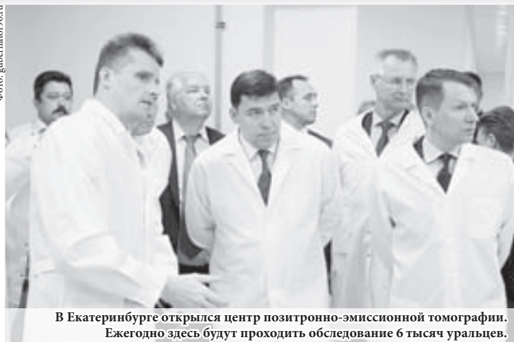
В Екатеринбурге открылся центр позитронно-эмиссионной томографии. Ежегодно здесь будут проходить обследование 6 тысяч уральцев.