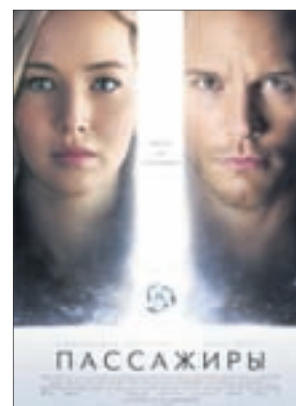
ПАССАЖИРЫ Фантастика (16+)

«Восход» (т. 66-74-45) «Сфера Синема» (т. 29-79-50)