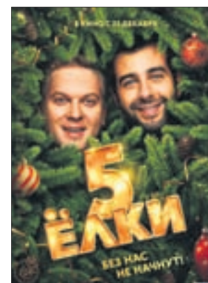
ЁЛКИ 5 Комедия (6+)