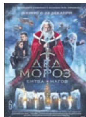
ДЕД МОРОЗ. БИТВА МАГОВ Фэнтези (6+)