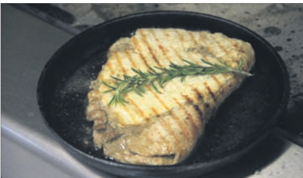
До готовности довести в духовом шкафу — запекать 7-10 минут. Готовому мясу дать «отдохнуть» 5-10 минут.