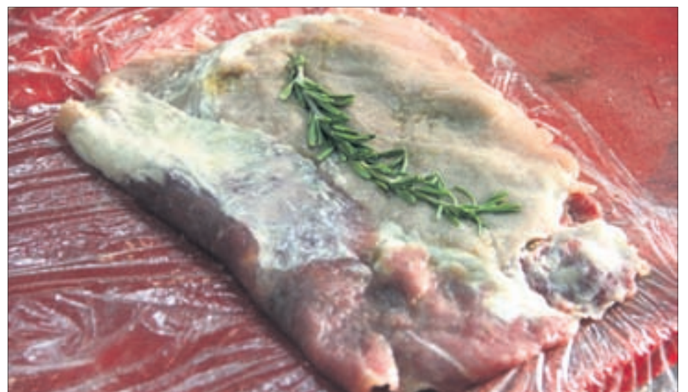
Стейк обжарить на раскаленной сковороде с маслом с обеих сторон.