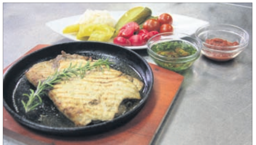
Подавать на порционной сковороде. На гарнир — квашеная капуста, малосольные огурцы и помидоры, маринованный чеснок и острый перец. Также к мясу рекомендуется подать острый томатный соус, соус из пряных трав со специями.