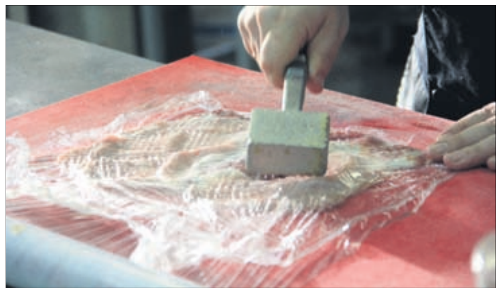
Обернуть в пищевую пленку и хорошенько отбить. Мясо залить соевым соусом, посолить, поперчить.