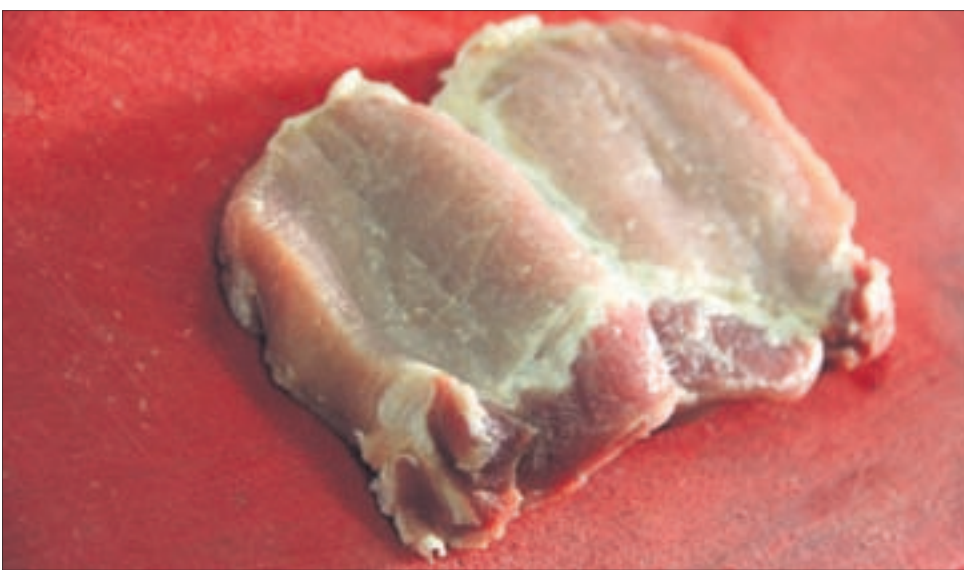
Корейку разрезать не до конца, разложить книжкой.