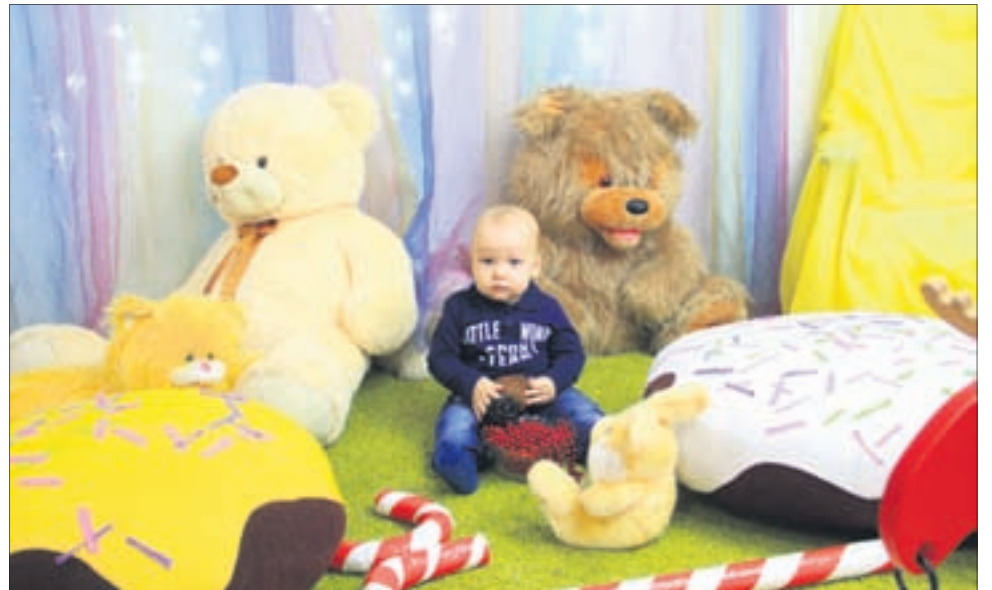
Фото Анны Неволіной