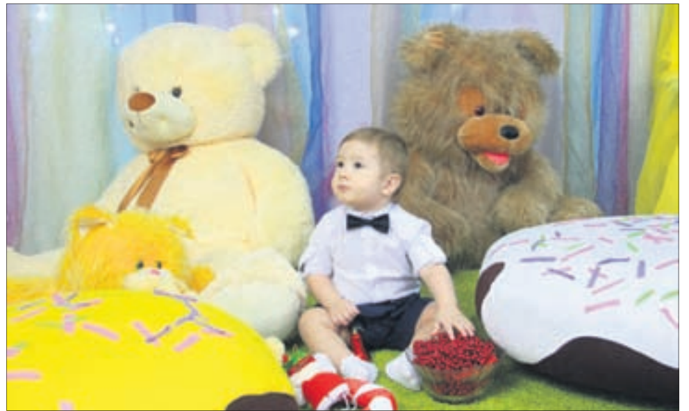
Фото Анны Неволіной