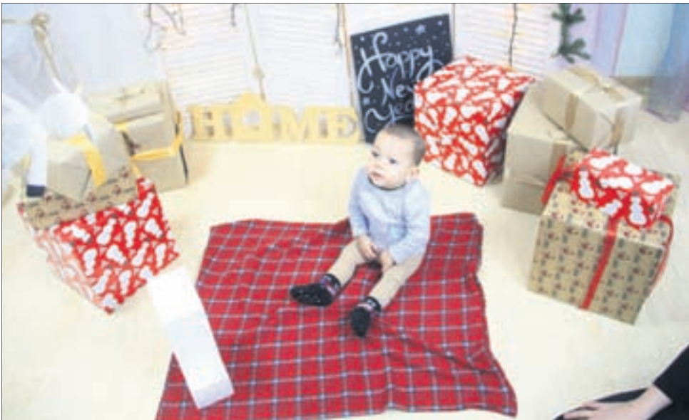
Фото Анны Неволіной

— Я очень своенравный мальчик, серьезный, смелый. Как настоящий мужчина, обожаю транспорт, а также шумящие, дребезжащие, сверлящие предметы. Громкие звуки меня не пугают: наоборот, чем громче, тем лучше. Люблю барабаны, трубы, пианино — все, что громко звучит. Поэтому соседи нас очень «любят». Нравится гулять. Люблю играть шуруповертами, стиральными машинами, например, а не игрушками. Кушать люблю все, что послаще. Но накормить меня — не проблема: ем все, что предложит мама. Смотрю развивающие мультики, слушаю радиостанцию «Европа плюс»: пока играют песни, танцую. Говорю «мама», «папа», «баба». Зубов у меня уже шесть. Ножками хожу сам. Первый шаг я сделал в десять с половиной месяцев. Я очень люблю своего старшего брата, мы играем вместе, терроризируем вдвоем кота.