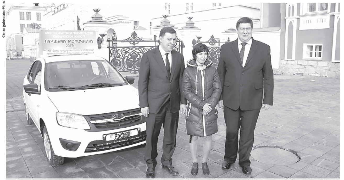
Губернатор вручил автомобиль лучшей доярке Свердловской области (АПК «Белореченский») Ларисе Шабиевой. На фото: губернатор Евгений Куйвашев, Лариса Шабиева и региональный министр АПК и продовольствия Дмитрий Дегтярёв.

«Компания планирует приступить к строительству тепличных комплексов. Это – хороший пример гармоничного сочетания коммерческого интереса и удовлетворения спроса населения на продукты питания».