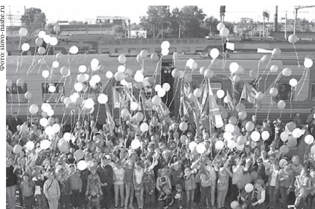
Летом прошлого года 1,5 тысячи уральских школьников смогли съездить на море благодаря региональному проекту «Поезд здоровья».