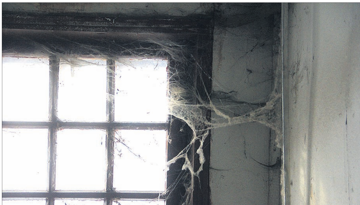
Фото Анны Неволينو

Неизменно одно: первоуральцы верят и утверждают, что уже в конце лета смогут паковать вещи. Переедут ли жильцы аварийек в новые дома к сентябрю — покажет только время.