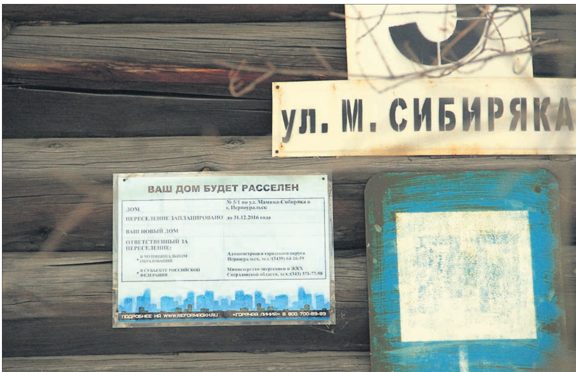
Фото Анны Неволينو