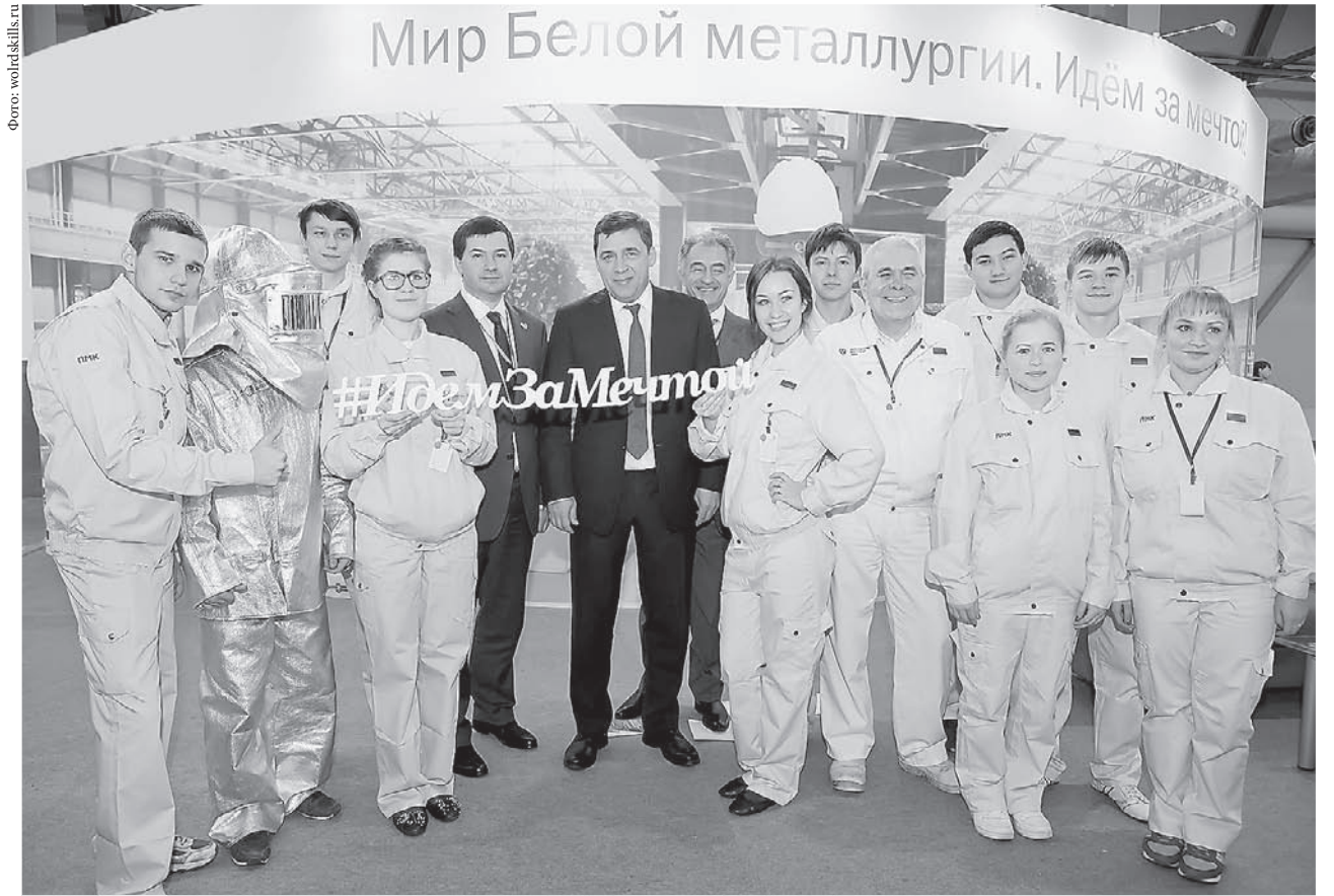
В регионе повышается мастерство специалистов по методике WorldSkills.

Один из резидентов технопарка – компания «НЕКСАН» планирует разместить высокотехнологичное производство промышленных теплообменников. Ещё один резидент – НПО «БиоМикроГели» – будет производить средства для очистки воды и твёрдых поверхностей от комплексных загрязнений, а также бытовую химию.