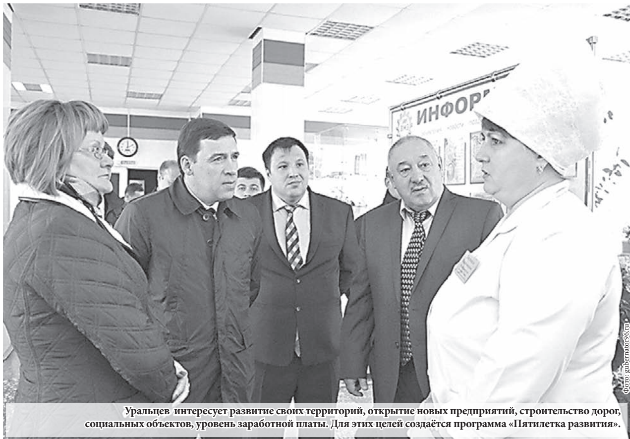
Уральцев интересует развитие своих территорий, открытие новых предприятий, строительство дорог, социальных объектов, уровень заработной платы. Для этих целей создаётся программа «Пятилетка развития».