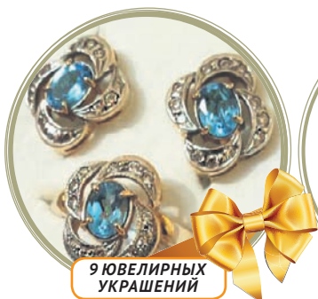
9 ЮВЕЛИРНЫХ УКРАШЕНИЙ

НАШ ПРАЗДНИЧНЫЙ РОЗЫГРЫШ СОСТОИТСЯ В ЮС «РУБИН» 24 ИЮНЯ В 13:00 ПО АДРЕСУ: УЛ. ТРУБИНОВ, 29 (ОСТАНОВКА маг. «ПРОДУКТОВЫЙ РАЙ»).