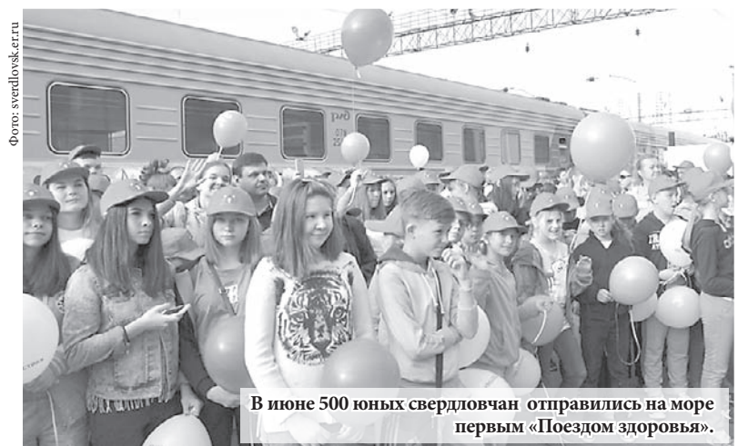
В июне 500 юных свердловчан отправились на море первым «Поездом здоровья».

Средний Урал входит в число регионов-лидеров России по объёмам финансирования оздоровительной кампании. Глава региона Евгений Куйвашев поручил обеспечить высокий уровень организации летнего отдыха детей, на который в этом году выделено 1,8 миллиарда рублей.