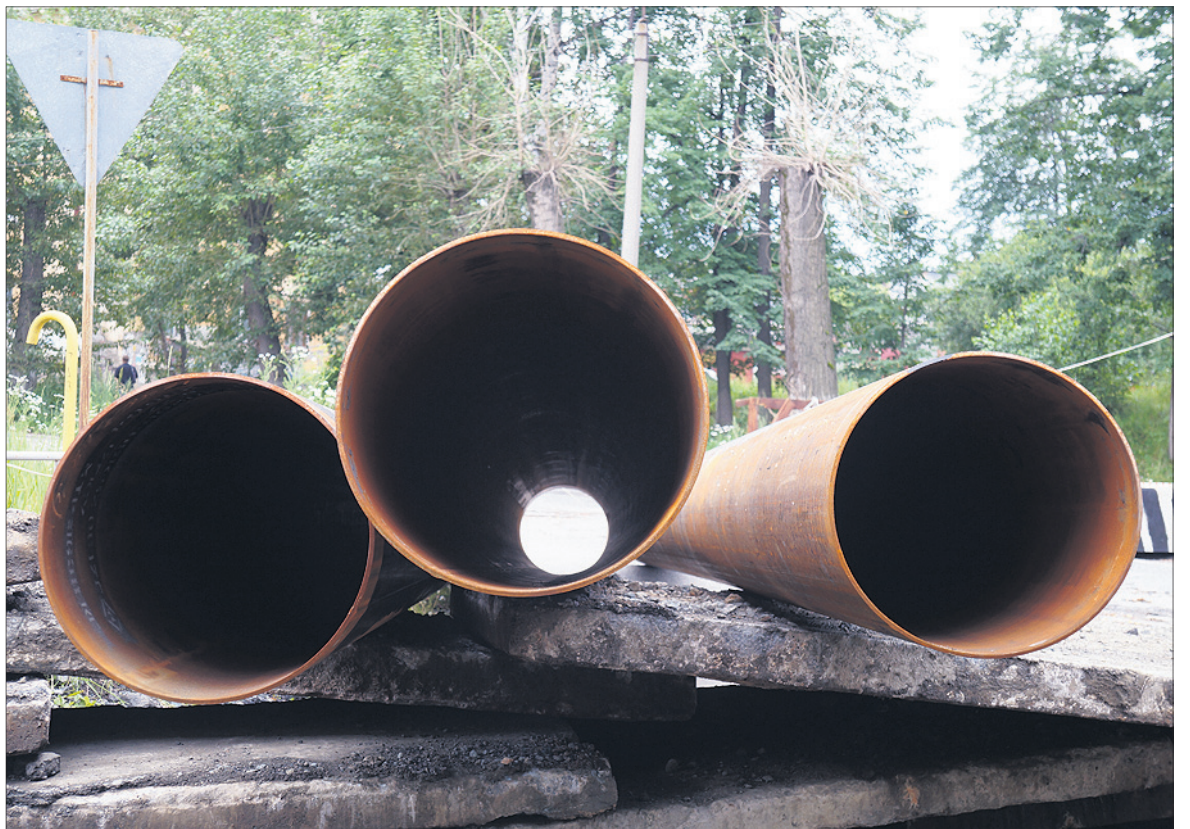
Сейчас в Первоуральске — три «глобальных ремонта» теплосетей.