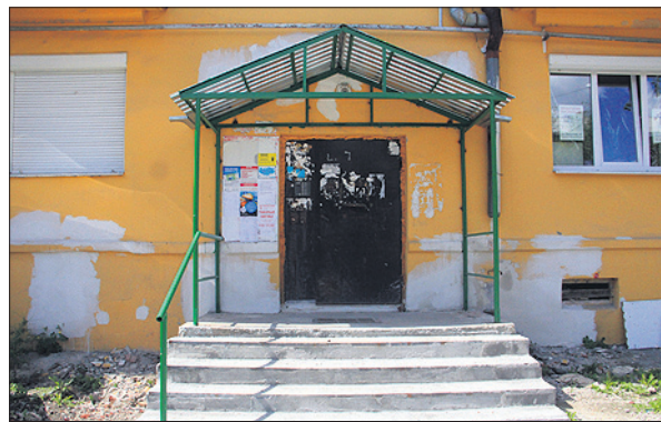
Соседний подъезд в том же доме.