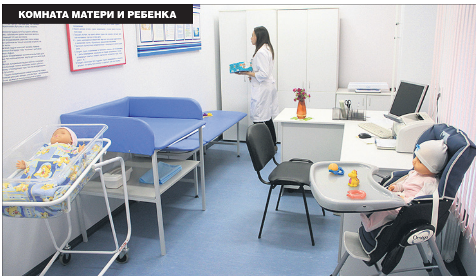
КОМНАТА МАТЕРИ И РЕБЕНКА

— Коридор у нас получился немного узкий, так спланировали, но по нормам всё проходит. Поток пациентов сюда небольшой, поэтому места хватает. В прививочном кабинете — новое оборудование, холодильники. Чисто и красиво.