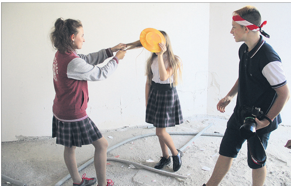
Школьники с энтузиазмом били посуду, работая над созданием фото.