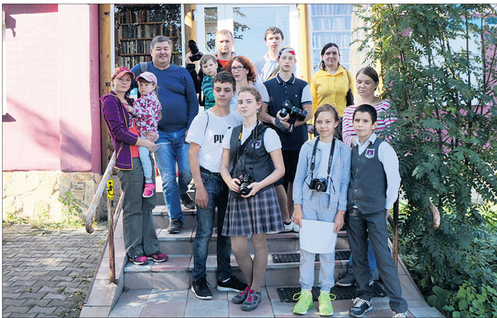
Получив кросс-листы, фотографы отправляются выполнять задания.

После того, как все снимки были выбраны, судьи приступили к работе. На этот раз гендерные пропорции в составе жюри были соблюдены идеально: 50 на