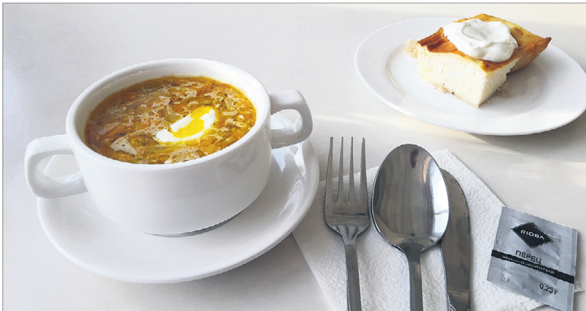
Вместе с облепиховым напитком такой обед стоит 138 рублей

Еду подают быстро — режут, накладывают в тарелки, греют в микроволновке, и вуаля!