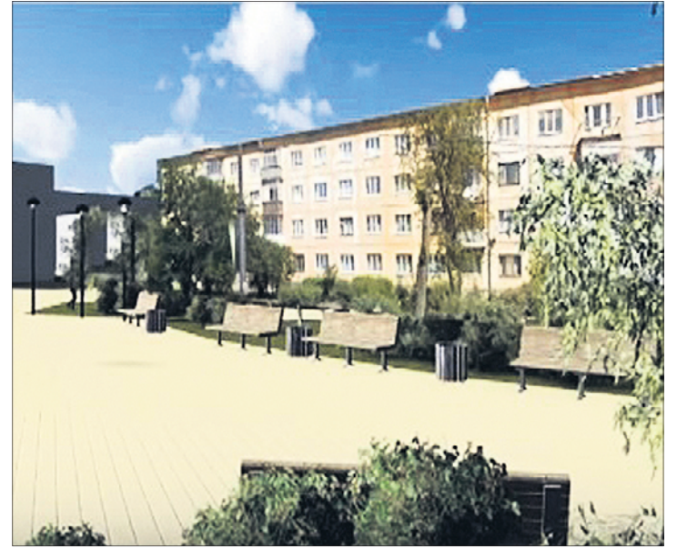
Фото неутвержденного проекта улицы Герцена

1 февраля стало известно, что концепция реконструкции улицы определена — разработчики предполагают, что оптимальным вариантом будет сделать Герцена односторонней для автомобилей. Движение сохранится по полосе от улицы Ватутина к Трубинов.