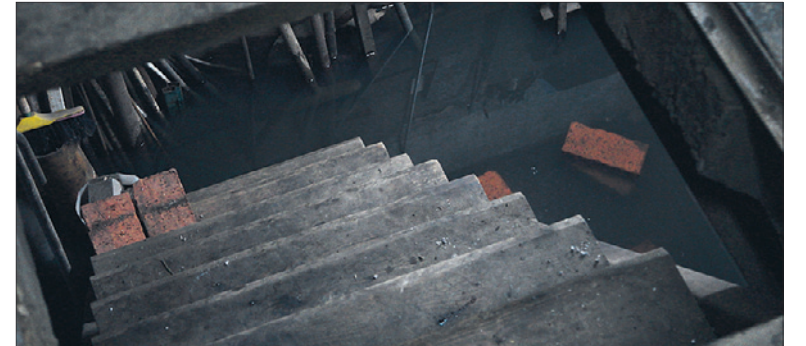
Гараж Владимира затоплен на 30 см.