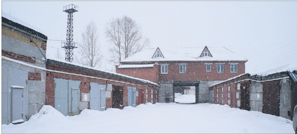
Гаражный кооператив «Сталь».

— 11 декабря я пришел на прием к начальнику УЖКХиС Марине Шолоховой. После этого к нам на место выезжали, взяли пробы во-