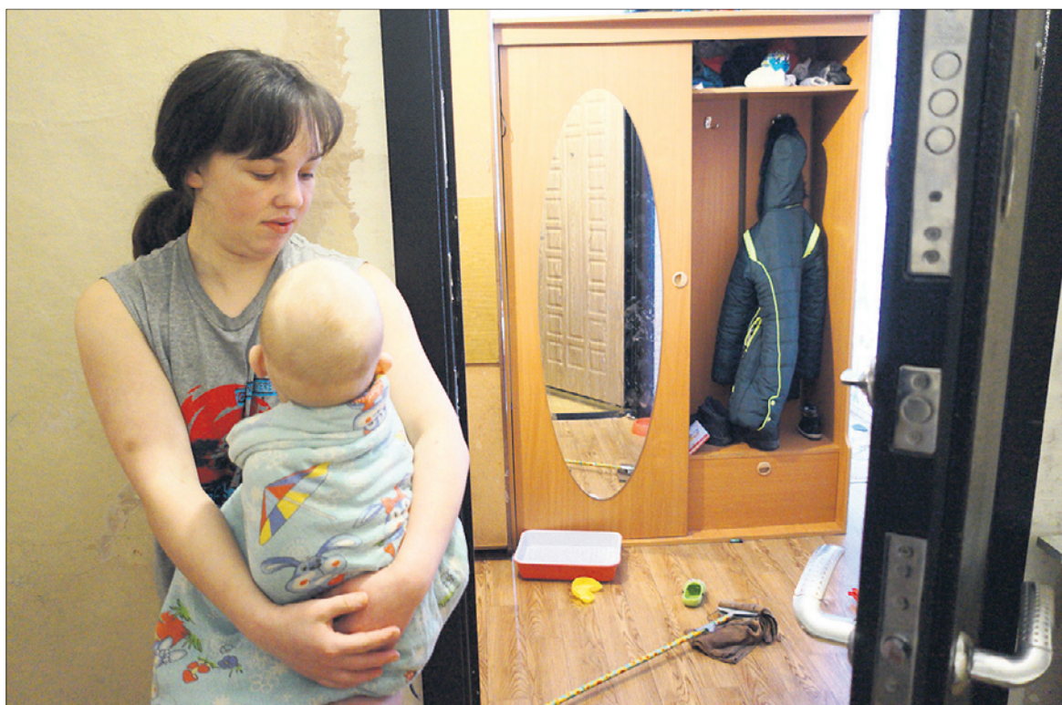
В бывшем женском общежитии много детей. По вечерам они все вместе бегают по коридорам.

шевую в качестве отхожего места и площадки для коротких, но, видимо, страстных, свиданий.