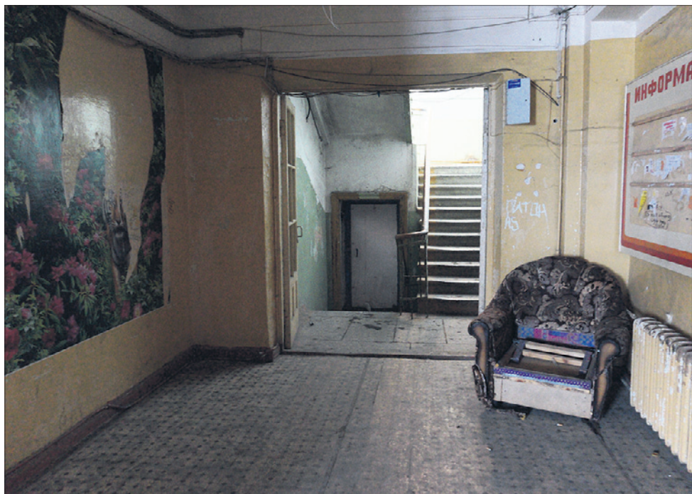
Это холл общаги — мрачный и неудобный.

Официально общежитие на Герцена, 2/25 считается многоквартирным домом. До недавнего времени его обслуживала УК «Губерния». Однако, по словам жителей, «управляшка» только счета выставляла. Ремонт обитатели общаги в коридорах делают за свой счет, застекляют разбитые окна тоже сами, самостоятельно поддерживают чистоту, меняют лампочки в коридорах. А вот пожарную сигнализацию отремонтировать не смогли, не стала делать этого и «Губерния». Еще одна коммунальная странность — неработающий домофон на одном из подъездов, счета за который выставляются ежемесячно. При этом, как говорят жители, они неоднократно просили его либо отремонтировать, либо убрать.