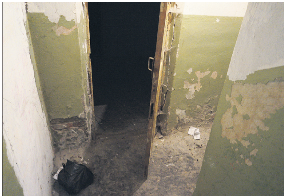
Здесь раньше располагались душевые.