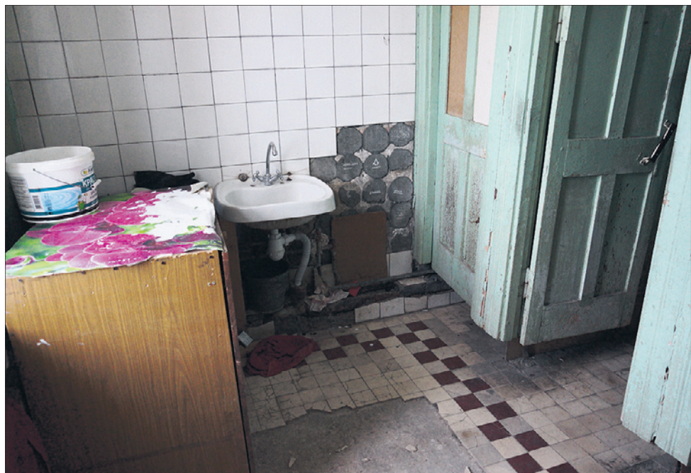
Общий туалет. Одна кабинка — на несколько комнат.