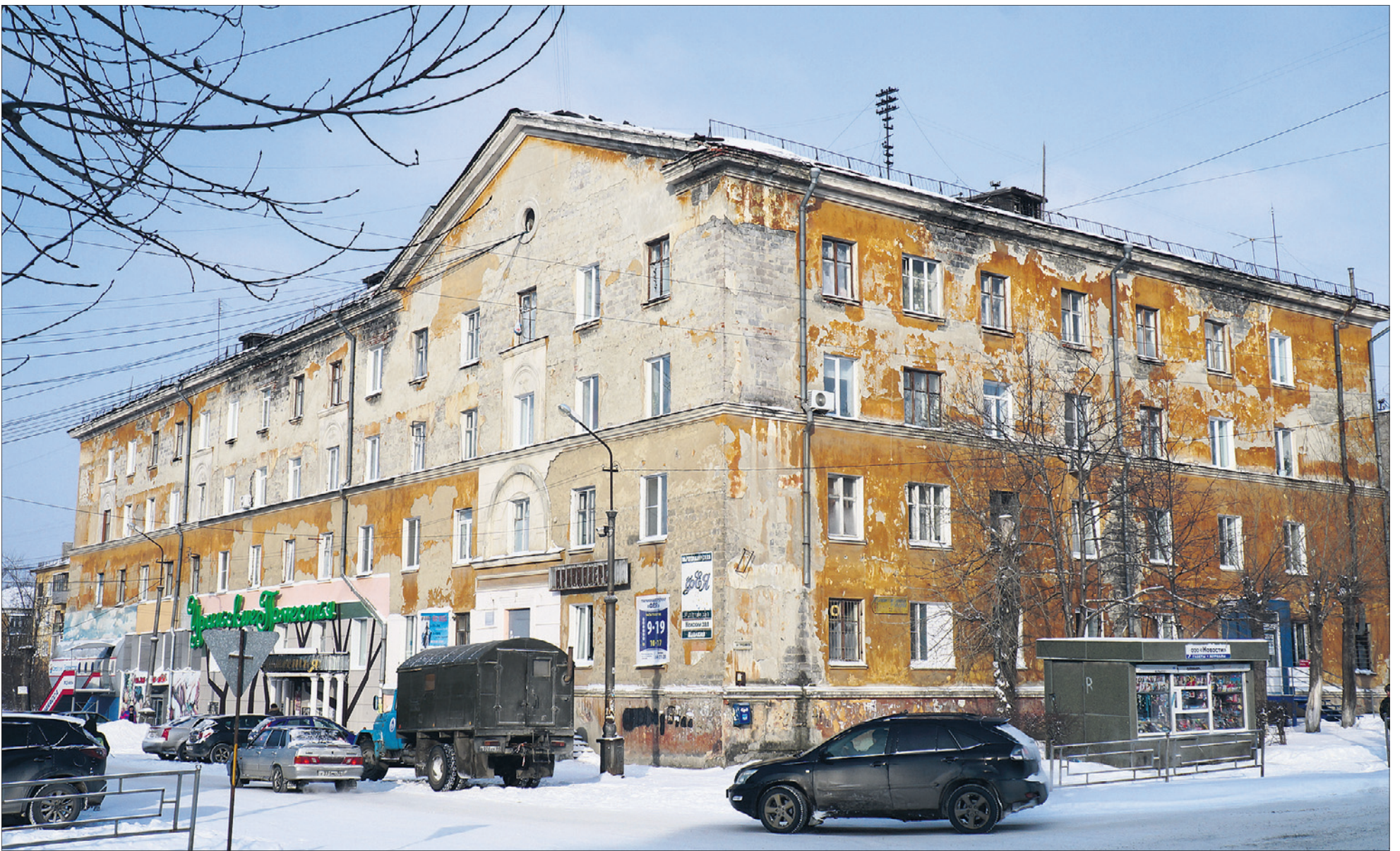
Здание на Герцена, 2/25, построенное в стиле сталинского ампира, давно нуждается в основательном ремонте.

Подготовила ЕКАТЕРИНА КАЛАДЖИДИ, ek@gorodskievesti.ru vk.com/id163408306