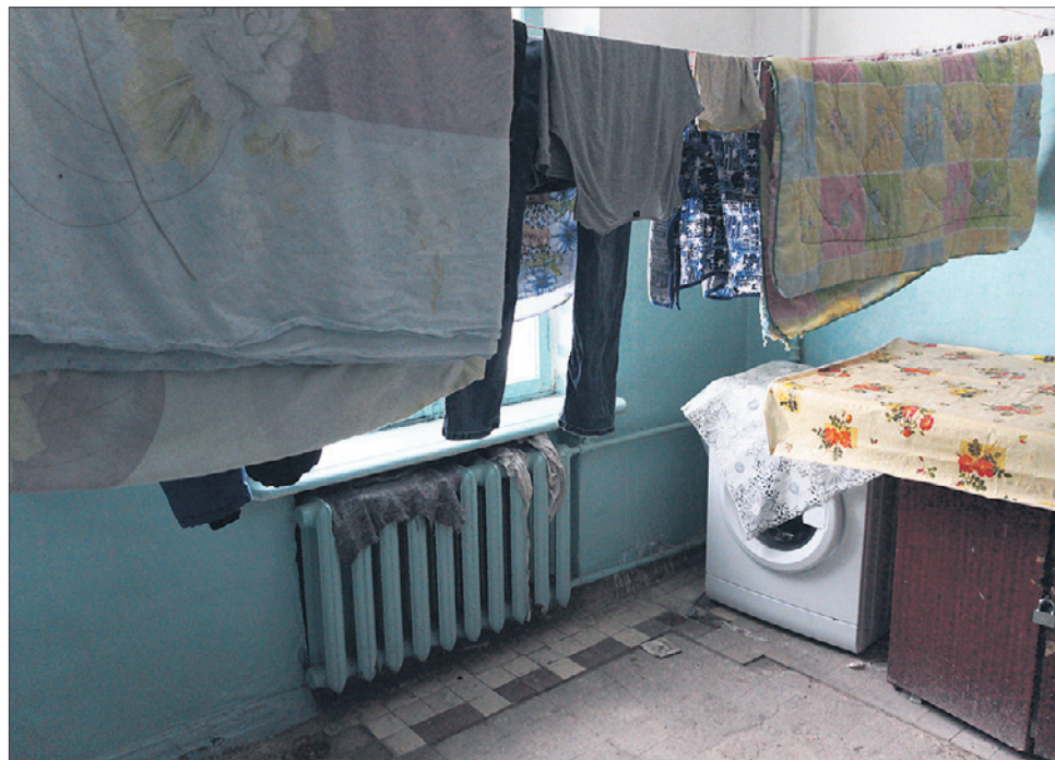
В «постирочных» стоят стиральные машины и сушится белье.