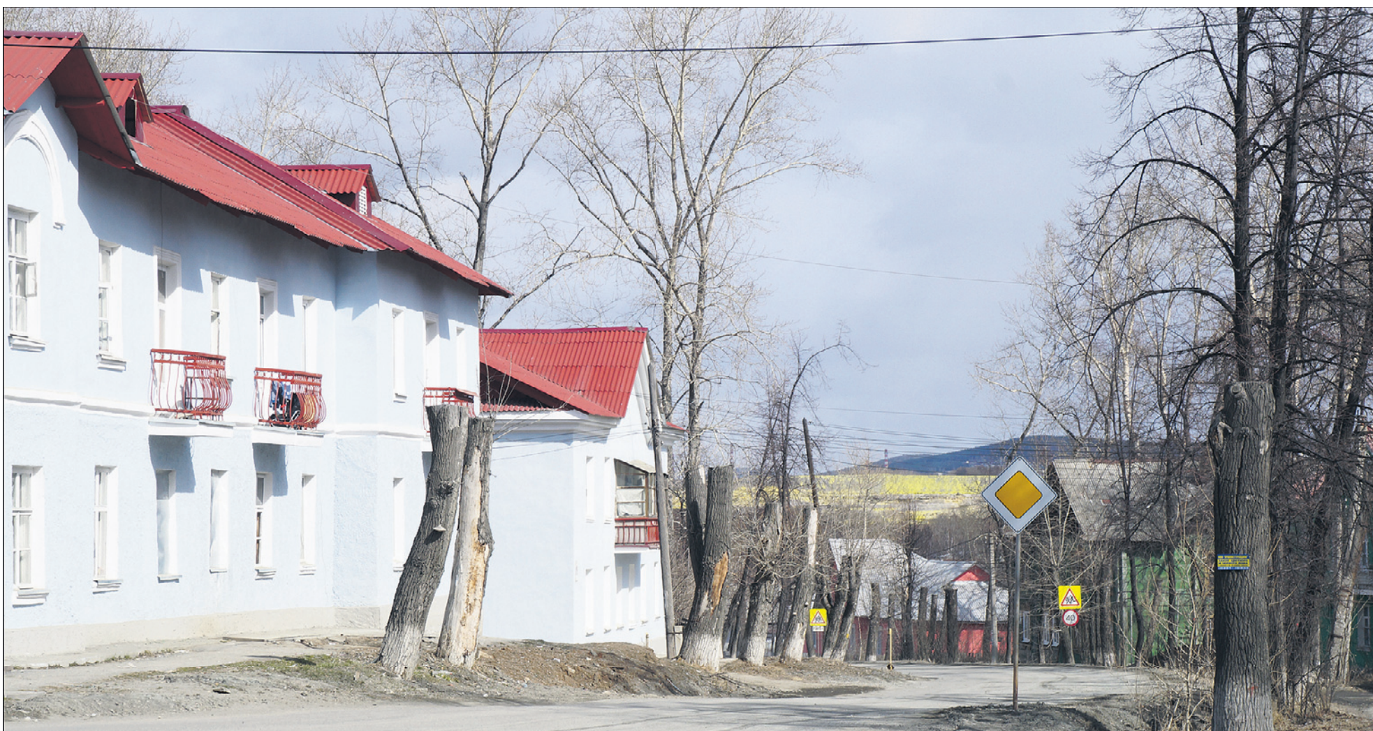
Магнитка удивляет архитектурными изысками и заброшенностью.

Подготовила ЕКАТЕРИНА КАЛАДЖИДИ, ek@gorodskiestesti.ru vk.com/id163408306