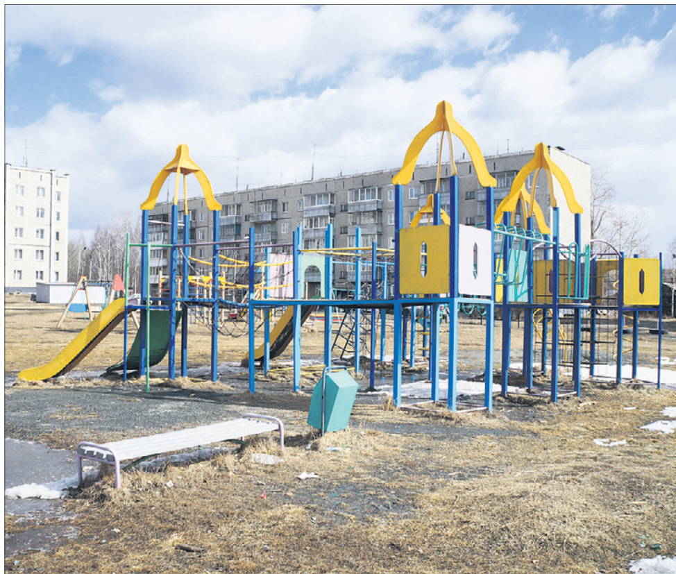
Детские городки Магнитки разнообразны, но неухожены.