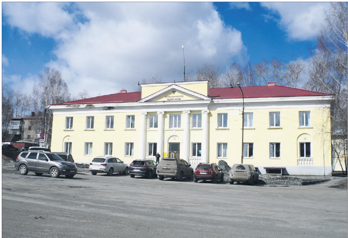
Первоуральское рудоуправление — образец сталинского ампира.