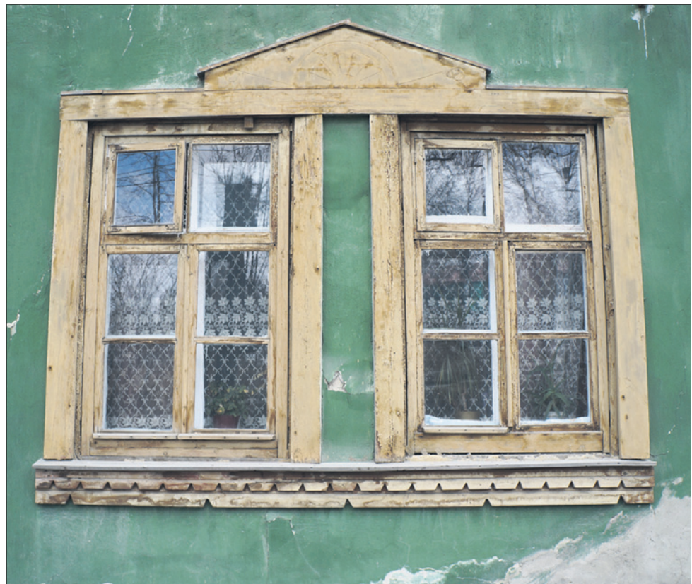
На Магнитке можно найти уникальные дома, которых нет ни в одной части Первоуральска.