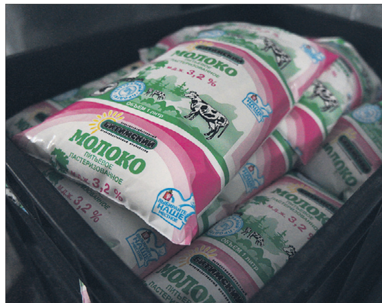
Вся продукция дожидается отправки в магазины в большом холодильнике.

Отгрузка в «Битимском» начинается с пяти часов утра. Представляете, вы еще спите, а молоко и творог уже едут к вам. Спешите за ними в магазин!