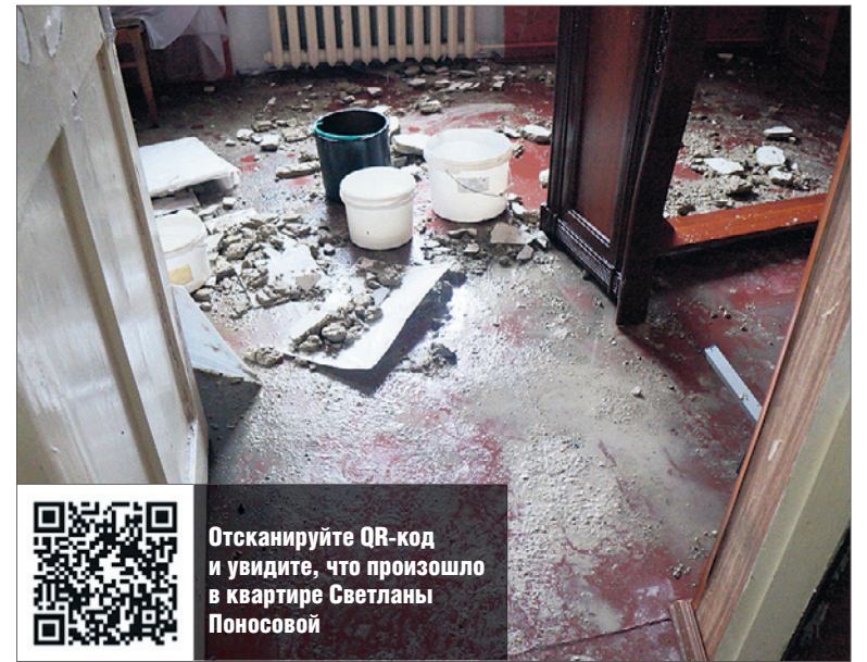
Так выглядела одна из комнат через час после аварии.

атмосферы, поэтому и десяти минут хватило, — объяснил Евгений Говелько, перекрывший отопление.