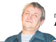
Подготовил АЛЕКСАНДР СОЛОВЬЕВ