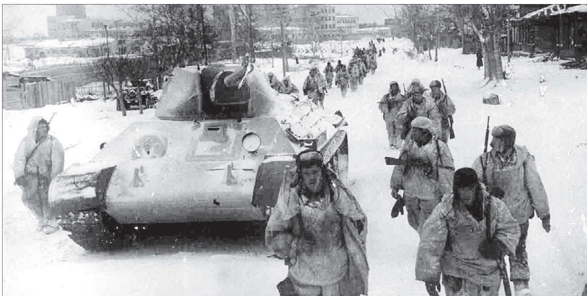
Уральцы входят в освобожденный город Клин.

Со 2 ноября 1941 года по 30 ноября 1941 года 365-я стрелковая дивизия находилась в составе 28-ой Резерв-