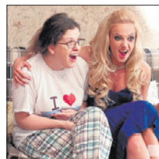
ТНТ • 20.00 «Деффчонки» (16+)