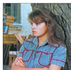
Первый • 13.30 X/ф «Школьный вальс» (12+)