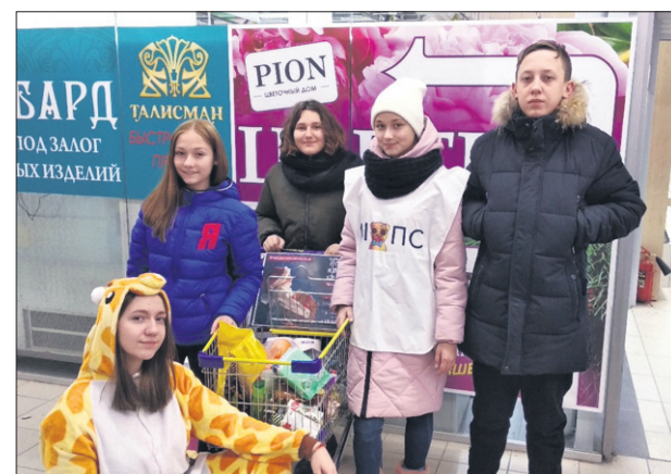
Общественники собирали подарки для малоимущих семей в ТЦ «Марс» — 5, 14 и 21 декабря.

По данным управления социальной политики, на учете в Первоуральском городском округе в качестве неблагополучных состоят около 130 семей. 50 из них уже получили подарки к Новому году от благотворителей.