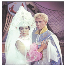
Первый • 07.00 X/ф «Огонь, вода и... Медные трубы» (0+)