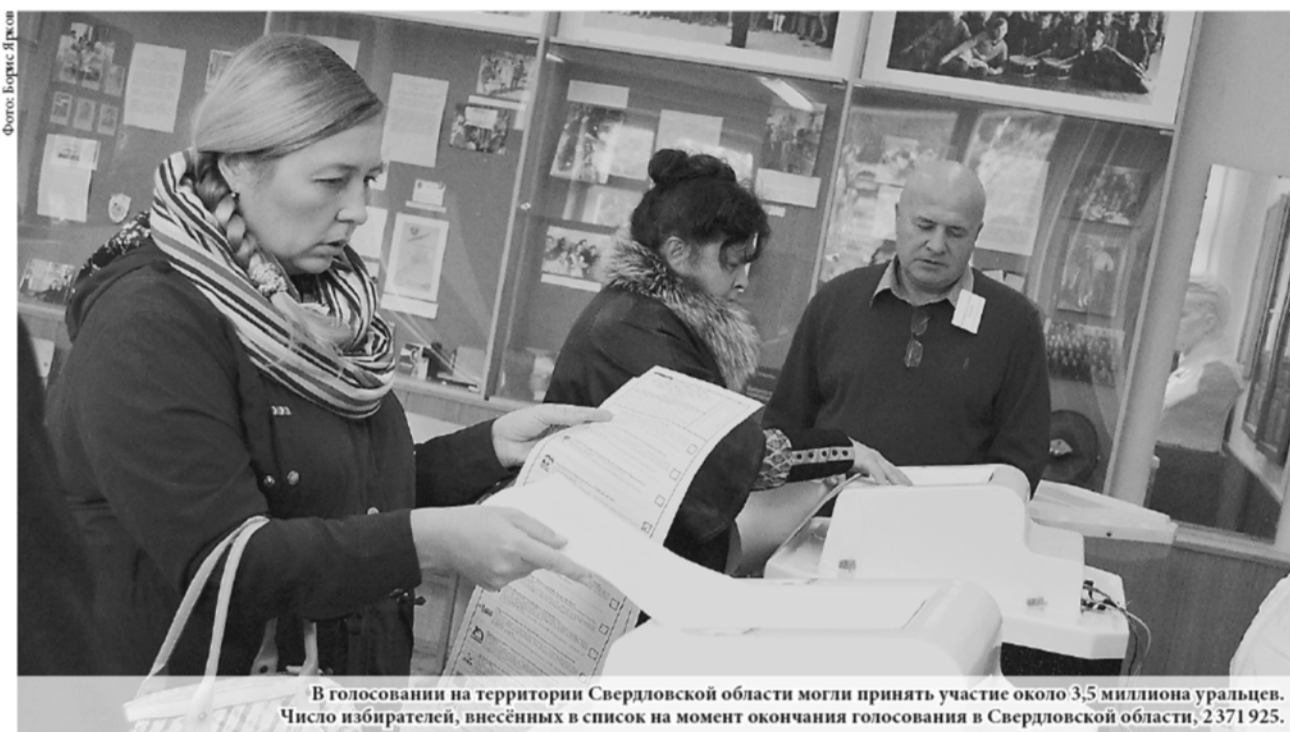
В голосовании на территории Свердловской области могли принять участие около 3,5 миллиона уральцев. Число избирателей, внесённых в список на момент окончания голосования в Свердловской области, 2371925.

Ранее Президент РФ Владимир Путин заявил, что выборы показали растущую политическую зрелость россиян, которые своим волеизъявлением продемонстрировали стремление к стабильной и надёжной ситуации в стране. Глава государства призвал будущих парламентариев от «Единой России» сотрудничать с другими фракциями и искать решения, которые будут приниматься всем обществом.