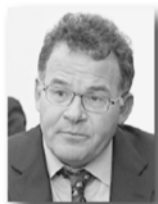
Первый вице-губернатор Владимир Тунгусов

За Алексеем Орловым будут закреплены промышленность, инвестиции, агропромышленный комплекс, наука, природный и ресурсный потенциал региона.