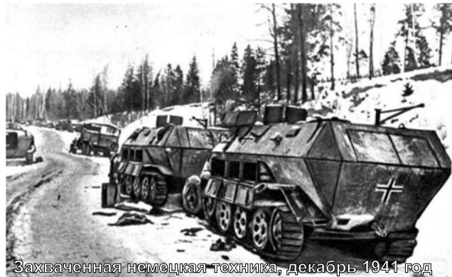
Захваченная немецкая техника, декабрь 1941 год

По всем вопросам обращаться в редакцию газеты или звонить по телефону: 8 908 914 31 57.