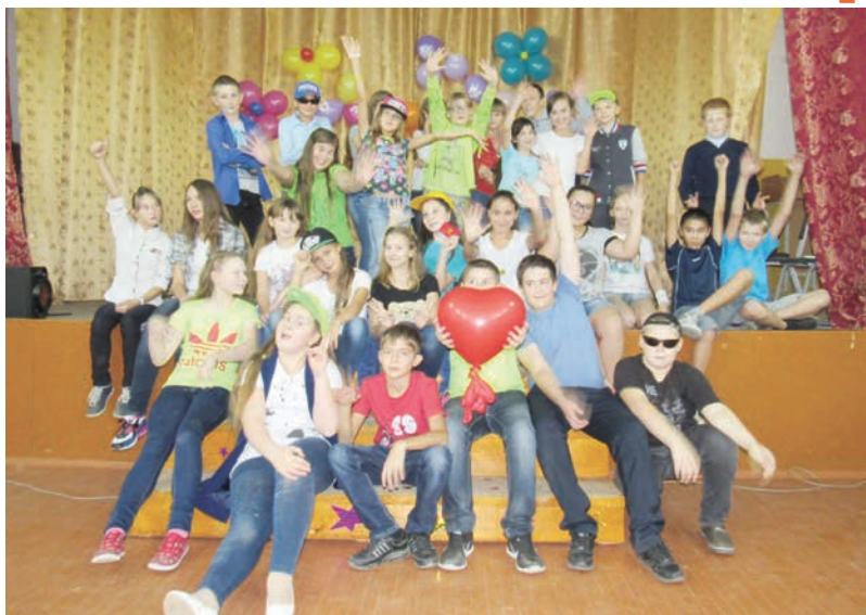
ева Инга. Министерские «порт- фели» получили те ребята, кото-

Наше «Содружество» действует и по настоящее время. И это - целый мир, в котором есть народ и своя система управления - президент и министры. Всенародно избранным президентом в 2016 году стала я, Неупоко-