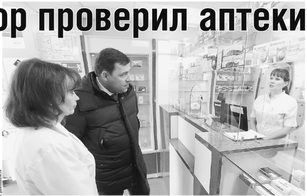
Губернатор лично убедился, что в аптеке есть полный перечень лекарственных средств, которые производятся в Свердловской области.

«Чтобы привлекать покупателей, мы приняли решение делать пенсионерам скидки на лекарства. К нам с удовольствием ходят посетители. Кроме того, мы заинтересованы в полноте ассортимента лекарств и контролируем строго этот процесс. Минимальный пакет лекарственных препаратов, который требуется по закону, у нас всегда есть», – отметила заведующая аптекой.