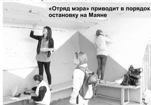
«Отряд мэра» приводит в порядок остановку на Маяне