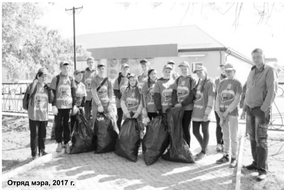
Отряд мэра, 2017 г.

Ребята каждой трудовой смены будут трудиться под руководством кураторов с педагогическим образованием. Уже ого-