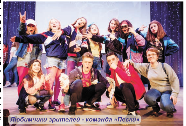
Любимчики зрителей - команда «Пески»

Первый конкурс традиционный - визитка команды. В данном конкурсе участники представляют себя, используя смешные шутки и миниатюры. Следующий - «Биатлон», где команды по очереди