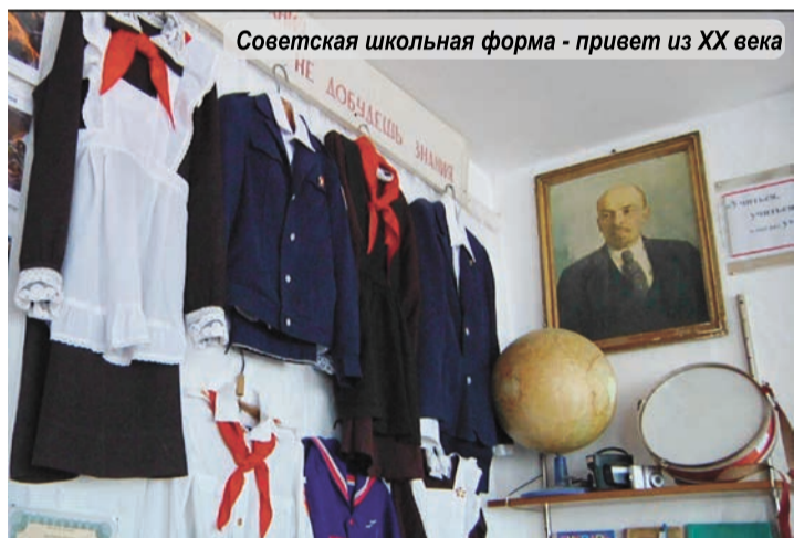
Советская школьная форма - привет из XX века