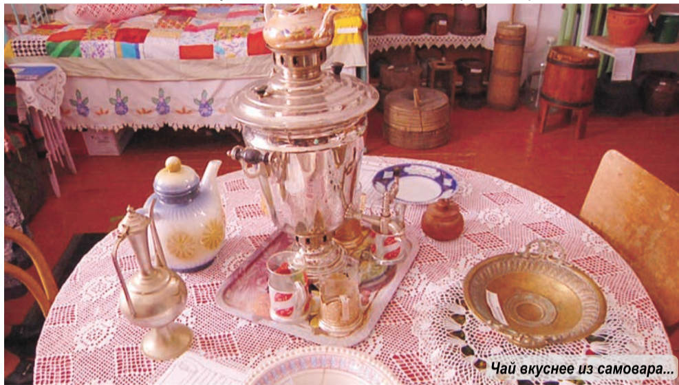
Чай вкуснее из самовара...

ние патриотическому направлению. Экспозиция, посвященная Великой Отечественной войне, станет наглядным пособием для учеников школ, здесь молодое поколение может узнать и увидеть фотографии тех, кто приближал Победу над фашизмом, это наши земляки, наши деды и прадеды, уроженцы села Смолинского. В виде мемориального столба сделан стенд о пропавших без вести и не пришедших с войны, отдельный угол с фотографиями и именами участников Великой Отечественной оформлен на самом видном месте музея. Их знают, ими гордятся, их внуки и правнуки продолжают жить на территории управы. Кто-то из дедов работал в тылу, кто-то воевал на фронте. А одна история прогремела на всю область.