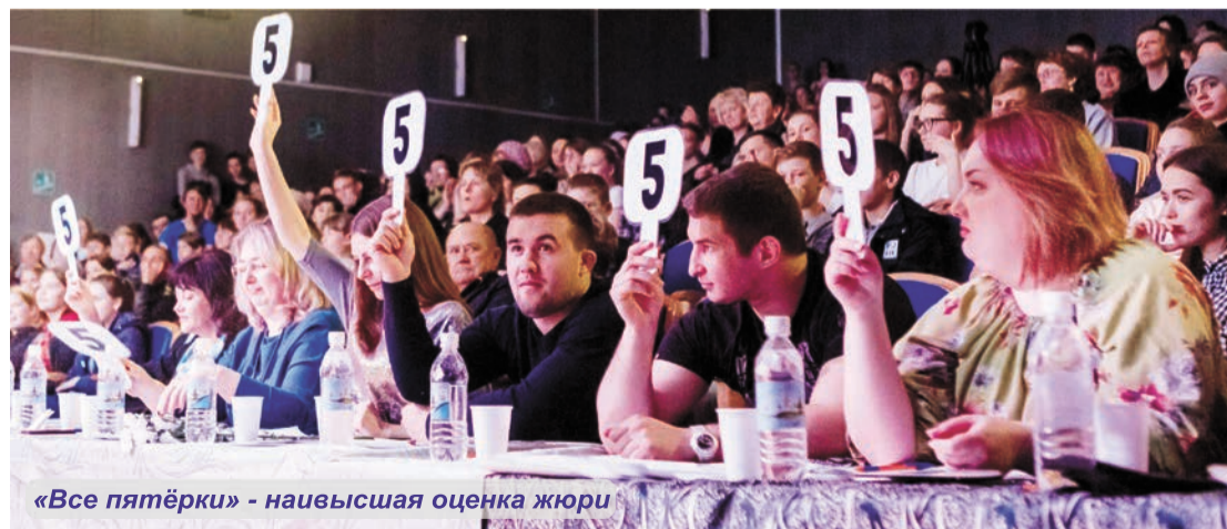
«Все пятёрки» - наивысшая оценка жюри

Фестиваль, безусловно, был настолько увлекательным и интересным, что хочется вновь и вновь пересматривать сцены. А мы говорим вам до скорых встреч, встретимся в следующем году и рассмешим зал тем же составом, а может даже и еще большим!