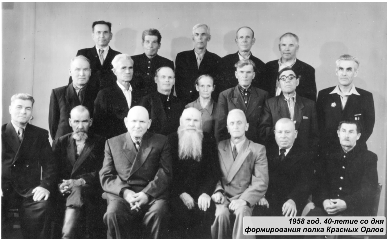
1958 год. 40-летие со дня формирования полка Красных Орлов

Участник Великой Отечественной войны на Северном фронте, имел ряд правительственных наград. По состоянию здоровья был демобилизован из армии в 1946 году в звании майора.