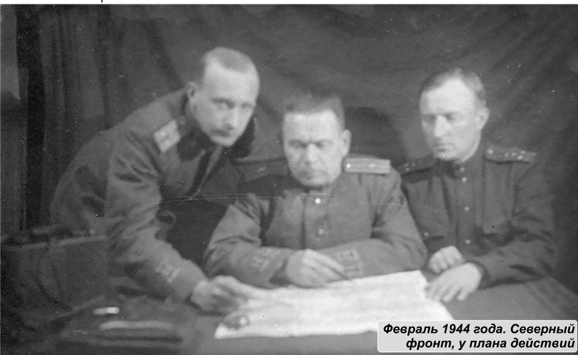
Февраль 1944 года. Северный фронт, у плана действий

В Путиловском отряде находился до марта 1918 года, после был направлен на Восточный фронт на Урал. В сентябре 1918-го получил назначение на должность командира