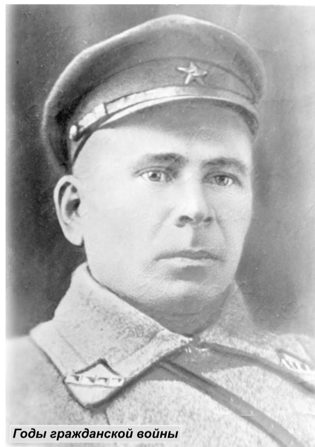
Годы гражданской войны

Надо отдать должное внимание и признательность моему деду за уличное освещение,