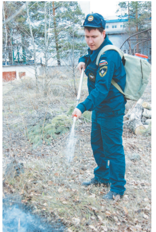
Пожарные тушили траву уже 6 раз.

Как правило, лесные пожары — затяжные. Ветер разносит пламя, а бороться с огнем пожарные могут только в светлое время суток — дым, падающие деревья — огромная угроза. Впрочем, как и горящие торфяники. Подземный пожар коварен тем, что никак себя внешне не выдает, и в горящую землю можно провалиться. Но у нас, к счастью, торфяников нет. Зато есть Шайтан, который исправно горит каждый год. Причина пожаров — снова человеческая безалаберность. На скалистой местности небольшой почвенный слой, деревья кое-как «цепляются» за землю корнями, поэтому для Шайтана губителен даже низовой пожар. В прошлом году деревья падали, создавая условия для более серьезных