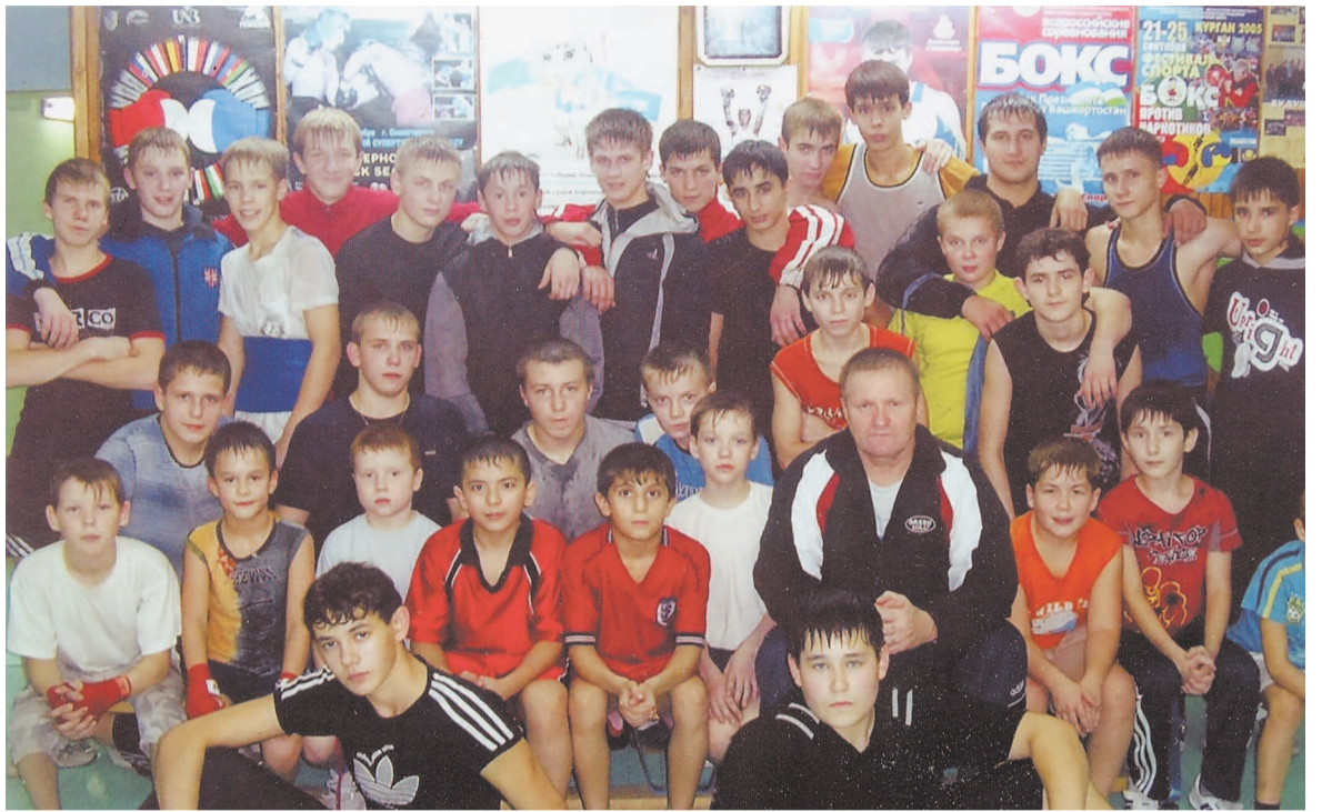
Тридцать три богатыря.

- Все эмоции ребята обычно растрачивают на ринге. И если у боксера после боя остается негатив к сопернику, значит он выложился в поединке не до конца, поберег силы, а с ними оставил и негативные эмоции.