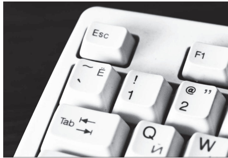
Буква «Ё» на клавиатуре есть! В левом верхнем углу.

Интересно, что буква «Ё» была введена в азбуку в ноябре 1783 года, когда общее собрание Петербургской Академии наук утвердило предложение её директора княгини Дашковой о замене сочетания «ю» на новую букву «ё». В декабре 1942 года приказом народного комиссара просвещения РСФСР было введено обязательное употребление буквы «Ё» в школьной практике. Насколько известно, этого приказа никто не отменял. 228 лет назад буква встала в алфавит под магическим, седьмым, номером. Может быть, поэтому с ней до сих пор происходят удивительные вещи? Почему то при оформлении самых разных документов редкие буквы в паспортных данных становятся непреодолимым барьером. По неведомой простому гражданину причине чиновники не всегда верят справкам из кадровых служб и бухгалтерий, утверждающих, что в разных документах указан один и тот же человек и его персональные данные везде идентичны. Хотя юристы утверждают, что во всем виноваты не чиновники, а казуистика. Где ещё (кроме России) есть буква, обязательная в книгах для де-