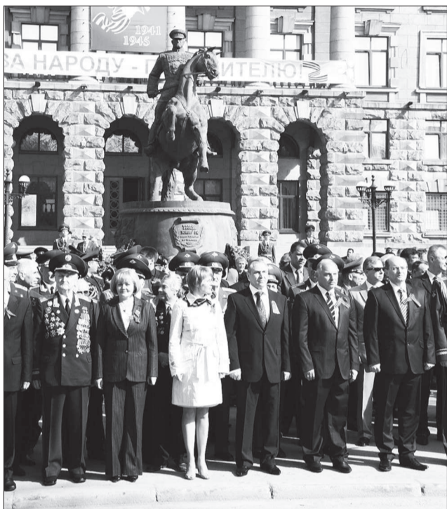
Торжественная церемония у памятника Г. К. Жукову.

Депутаты обеих палат Законодательного Собрания Свердловской области приняли участие в мероприятиях, посвященных Дню Победы