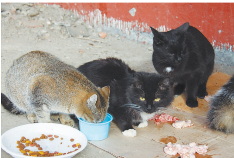
В «столовой» кормят по-королевски.