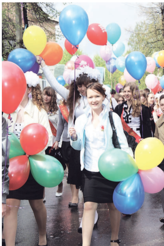
С шарами и в бантах - как в детстве.