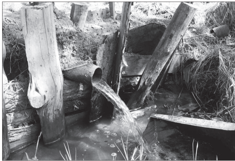
Тот самый единственный источник влаги.