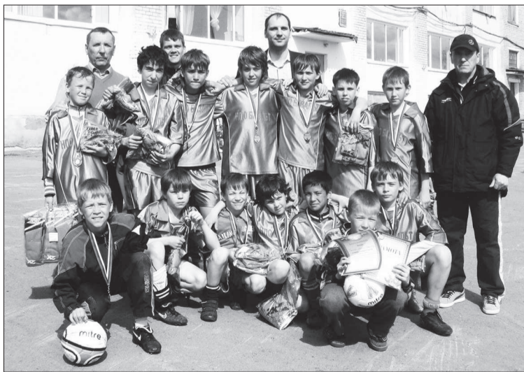
Команда «Старт» билась за победу до последнего.