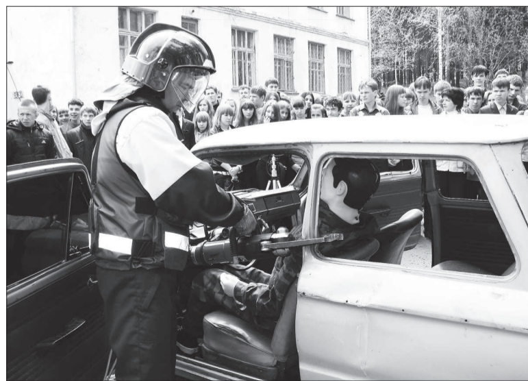
В руках спасателя – гидравлические ножницы.

На школьном дворе в линейку перед гимназистами «выстроились» чудо-помощники спасателей – спецсредства: