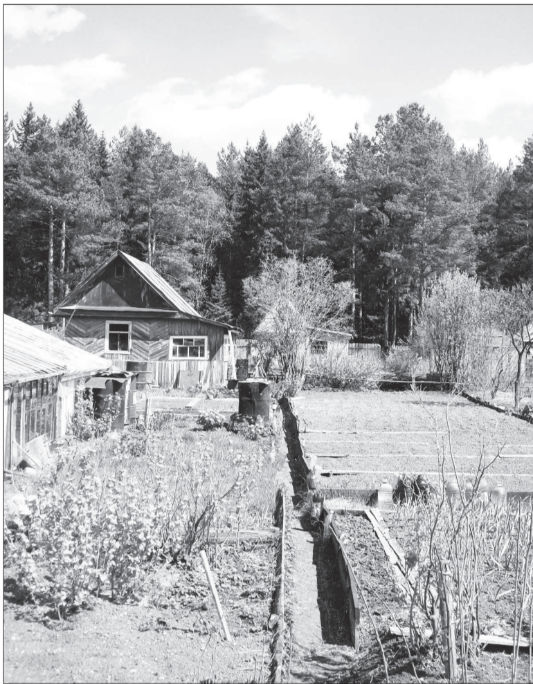
Символ трудолюбия – полный порядок на садовом участке.

СЕМЬ лет уж мучаются садоводы товарищества под оптимистичным названием «Восход». Видать, только оптимисты здесь и выживают – семь лет на минватовских садовых участках нет воды. Добывают здесь воду, как как может. Привозят на личном транспорте (иной раз по 150 литров за ходку), кто побогаче – бурят скважины. Единственный на местном рельефе ручей берется всеми силами – как заправские бобры запрудили ему путь, неся отсюда воду в ведрах и лейках, возят в горку на тележках. Но ручей доступен садоводам лишь ближних участков, да и мелеет он летом. Прошлогоднее жаркое лето здесь вспоминать не хотят