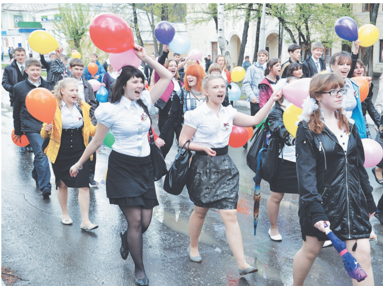
Сотни мальчишек и девчонок прошли по главной улице города.