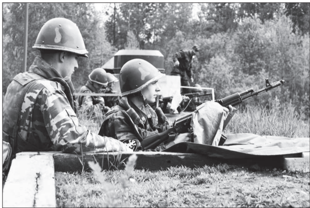
Стрелки притаились в учебном окопе. Мишеням осталось жить недолго.

ПОД треск автоматных выстрелов в минувшую пятницу завершились пятнадцатые учебные сборы десятиклассников округа. Отмечать учебными стрельбами «дембель» на сборах принято по давней традиции. Вместе со школьниками стрельбище посетили студенты ПЛ № 22.