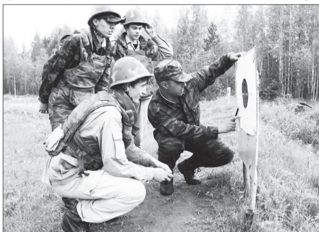
Неплохо для первого раза. «Противника» ранили в ногу.