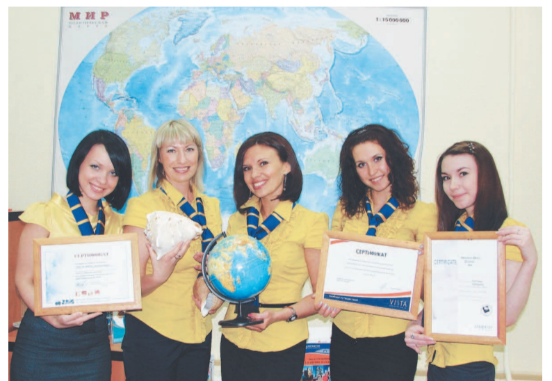
По итогам пяти месяцев уполномоченное агентство TEZ-TOUR УК «Виста» заняло третье место в Свердловской области по количеству проданных туров.

С самого основания TEZ-TOUR работает под девизом «С нами надежно!». TEZ-TOUR заботится о клиентах, начиная с момента бронирования путевки и до момента возвращения домой. Наши ориентиры — это качество, надежность и индивидуальный