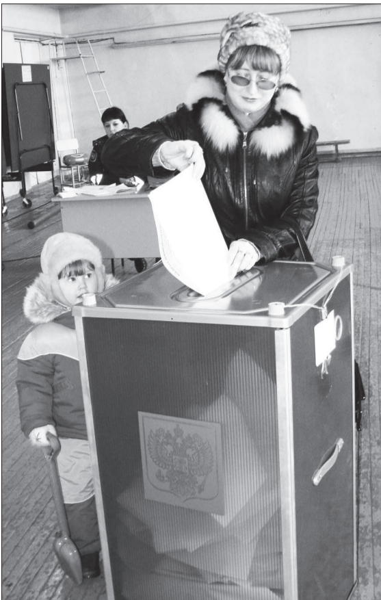
Ближайшие выборы - в декабре этого года.

Теперь выборы единого органа государственной власти субъектов РФ будут раз пять лет