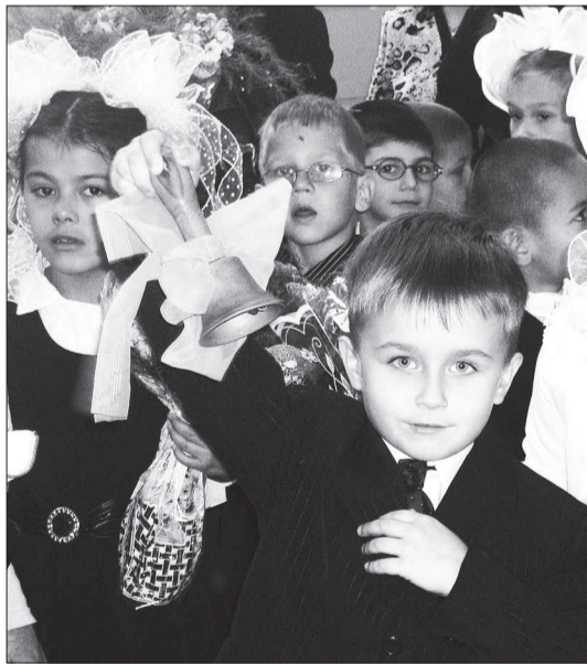
1 сентября первый звонок прозвучит для 290 первоклассников нашего округа.

Особое внимание в регионе уделяется оснащению учебных заведений компьютерной техникой: практически все школы подключены к широкополос-