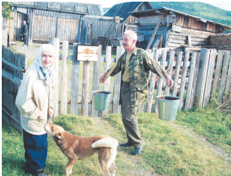
Кто трудится, тому в Косье во все времена хорошо.

при этом быт в глухих горно-таежных местах наладил.