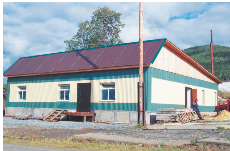
Предприниматель из Качканара строит в поселке новый магазин.

До сих пор в различных географических справках значится, что в здешних местах «водятся» золото и платина. Спустя десятилетия после того, как иссякли богатые запасы драгоценных металлов, по старинным слухам, «питавшие» когда-то пол-Европы, в Косью снова пришли гидравлисты — искать золото механизированным способом. Поселковые жители вначале приободрились — работенка подоспела, а тут выяснилось, что специалистов-то в поселке и не оста-