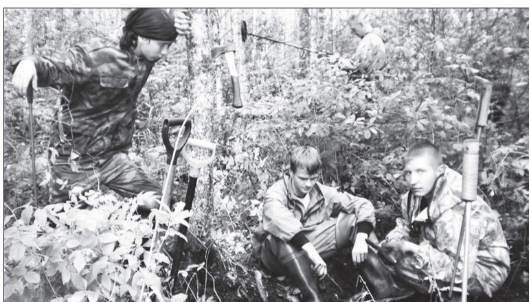
Многие вещи поисковики находили прямо на поверхности земли.

«ВОЙНА не закончена, пока не похоронен последний погибший солдат». Эту позицию великого русского полководца Александра Суворова бойцы поискового отряда «Горизонт» разделяют полностью. И бережно хранят свои традиции, зародившиеся двадцать лет назад.