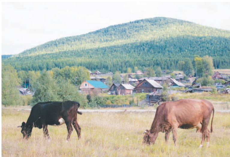
Пейзаж почище швейцарского.

Отзывы о теперешней жизни в поселке стандартные: дороги отвратные, уличного освещения нет и в помине, с электричеством перебои, покосы заброшены, загороди для скотины все попадали — словом, поселок в полном бесперспективном запущении. Даже милиции теперь не стало, ни одного участкового (если он где-то и числится, то люди