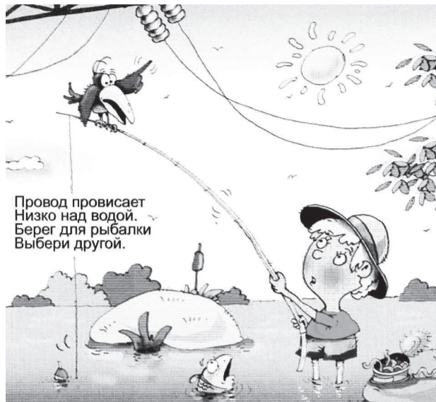
Провод провисает низко над водой. Берег для рыбалки. Выбери другой.