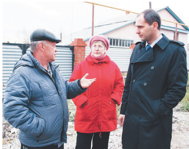
На встрече с жителями в частном секторе.