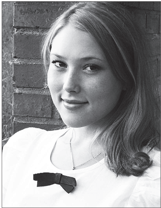
Ей удастся настроить себя на позитив.

Ее ребенком назвать уже трудно, судя по взрослости и масштабности размышлений. Она учится в одиннадцатом классе третьей школы. Уверена, что 17-18 лет — самый чудесный возраст человека: и бремени ответственности еще нет (в большей мере, сам себе предоставлен), и уже чувствуешь в себе силы для больших свершений. До десятого класса она не была отличницей, а в десятом почувствовала комфорт в новом коллективе и вкус к отличным результатам. Теперь старается получить от учебы максимум удовольствия. Обожает уроки английского языка, гуманитарные предметы, точные науки даются не так шикарно. Усидчивой себя не считает, но талантом к познанию явно одарена. Отучилась в музыкальной школе на хоровом отделении, так что одна профессия на всякий случай имеется. Но в будущем она себя ви-