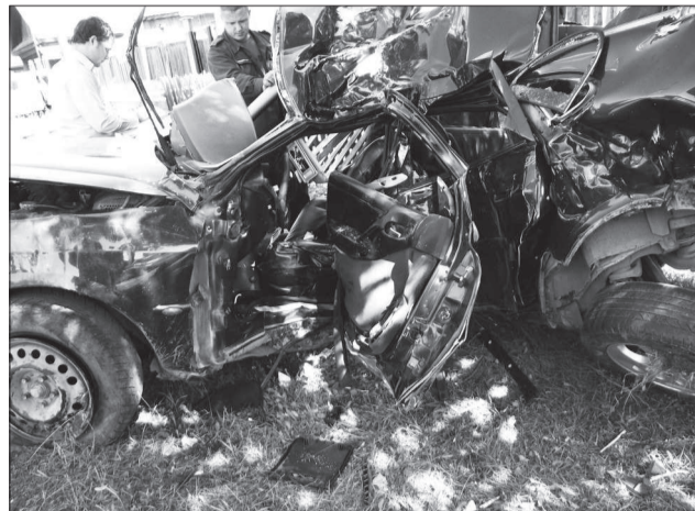
Скорость и алкоголь погубили водителя.

3 июля в 18.00 в поселке Федино водитель ИМЗ-8-103-10, двигаясь по улице Артема с превышением скорости — ехал он 70-80 км/ч, напротив дома № 180 не вписался в поворот, съехал с проезжей части, наехал на «километровый» столбик, потом — на водосточную трубу, мотоцикл перевернулся. Водитель погиб сразу, пассажир умер на 8-е сутки. Оба были в состоянии алкогольного опьянения.