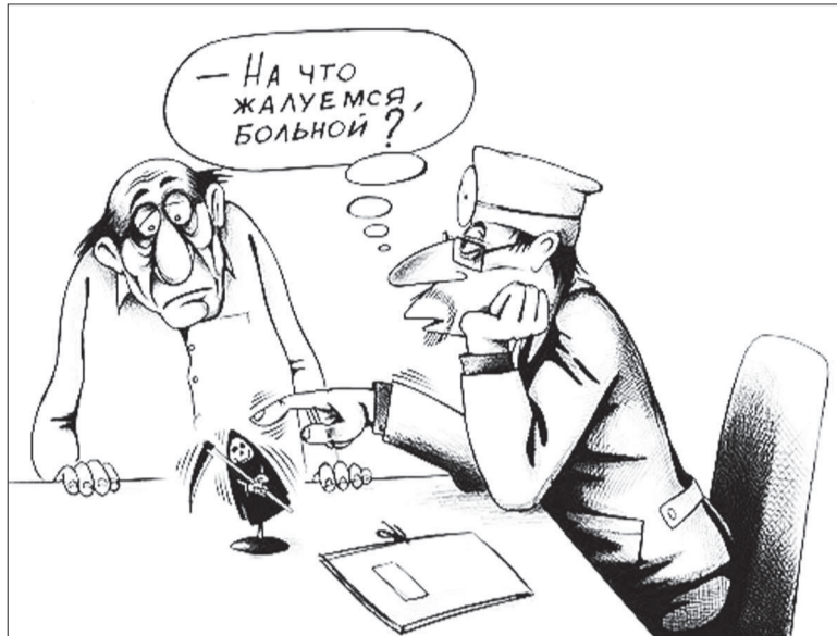
Иллюстрация с сайта www.caricatura.ru .

А теперь обратите внимание на хронологию событий: в 6.10 я попала в «Скорую помощь», в 6.40 — отправилась на снимок. В 7.00 — появился рентгенолог, который, конечно же, спросил: «Что случилось?». Некоторое