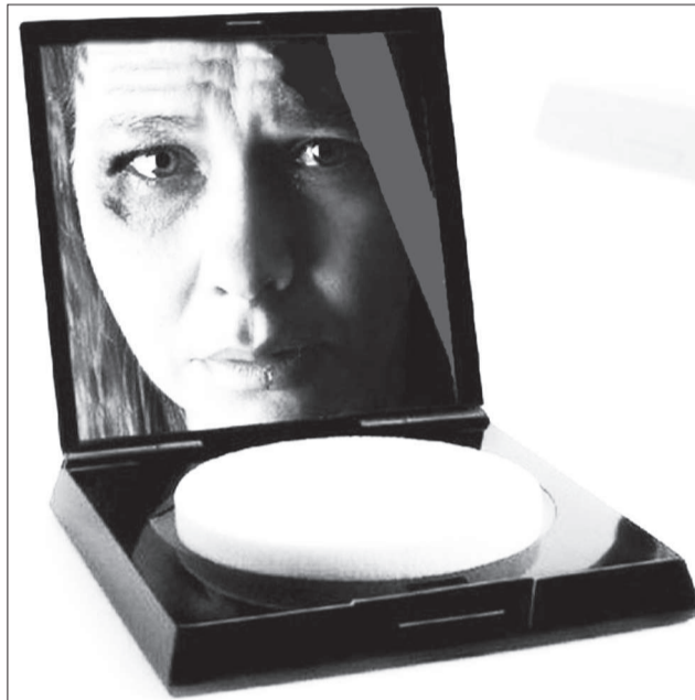
Во Франкфурте женщинам раздали тысячи таких пудрениц в рамках социальной кампании против насилия. Зеркало «отражает» избитую женщину и номер «горячей линии».

Подробнее стоит остановиться на самом «доступном» насилии — эмоциональном. Пострадавшими женщинами составлен список популярных мер пристрастования жен. Среднестатистический мужчина, даже не подозревающий в себе природу насильника, через некоторое время после свадьбы начинает постоянно критиковать свою возлюбленную жену, поднимать на смех ее убеждения, обижать ее родственников и друзей с тем, чтобы прекратить общение с ними. Потом запрещает выходить на