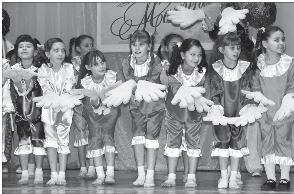
Носики-курносики - «Антре».

Слова благодарности всем Матерям, дарящим детям любовь, доброту, нежность и ласку прозвучали в выступлениях заместителя главы НТГО по социальной