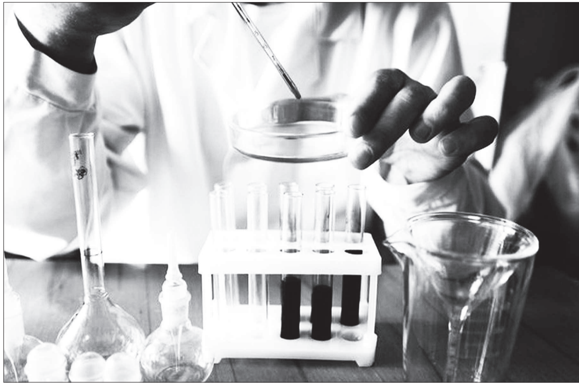
Общепринятым считается представление, что СПИД возник среди шимпанзе.

ВИЧ-инфекция - заболевание, вызываемое вирусом после того, как он попадает внутрь человека, ослабляет иммунную систему. На протяжении нескольких лет организму удается удерживать ВИЧ под конт-