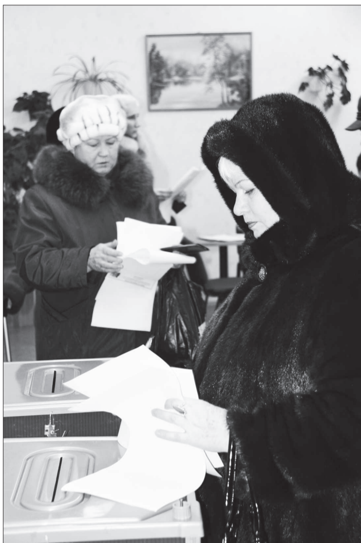
В этот день каждый думал о будущем страны.

Интересно, что наибольший процент голосов по округу избиратели отдали «Единой России» в поселках Платина и Сигнальный. «Справедливая Россия» лидировала у избирателей в