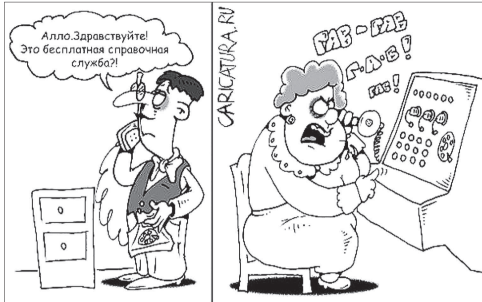
Поберегите нервы, не отвечайте на хамство хамством.

Через дорогу от поликлиники — налоговая инспекция, направляюсь туда. Перед входом в кабинет топчется пароч-