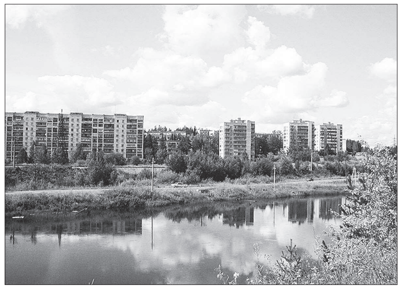
Современный город.

В 1734 году у подножия горы Шайтан был построен железодельный завод, и сюда пришла новая цивилизация. Почему новая? Да потому что на этих землях уже была человеческая цивилизация — в