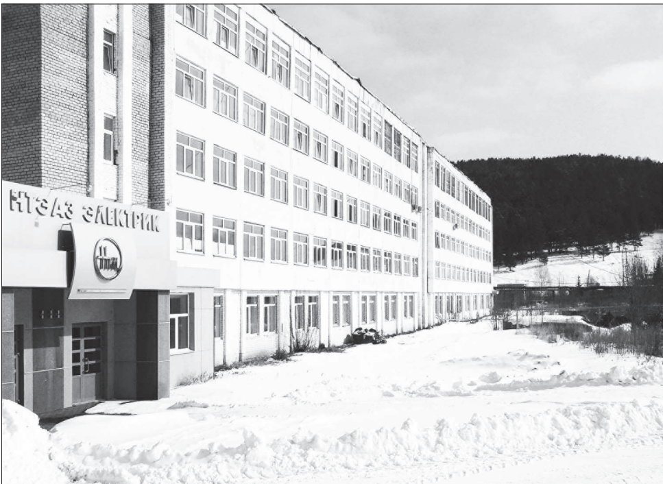
Нижнетуринскому электроаппаратному заводу - 55 лет!

29 ЯНВАРЯ 55-летний юбилей отменило ООО «Нижнетуринский электроаппаратный завод» - российская производственная площадка концерна «Высоковольтный союз» (Екатеринбург). Завод представляет собой современный технологичный производственный комплекс, неотъемлемую часть кон-