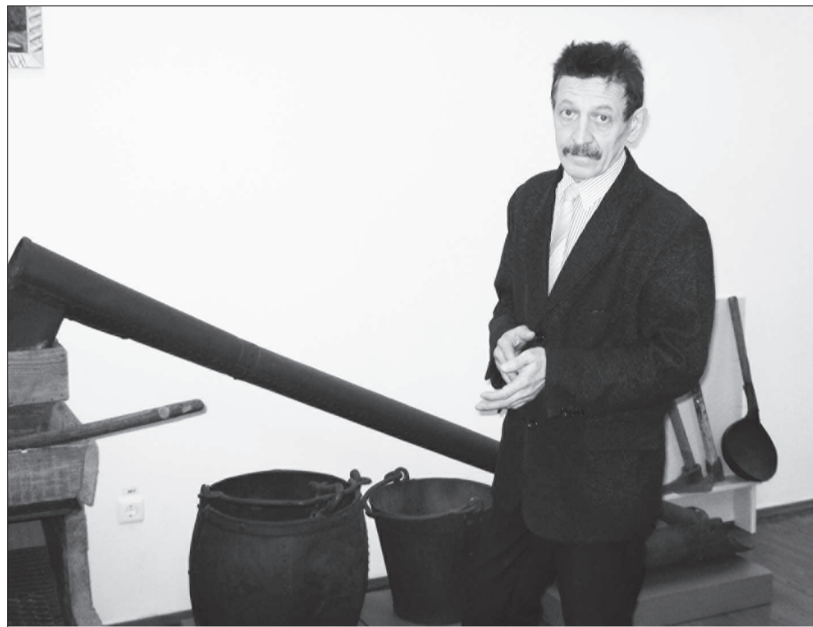
Теперь музей - Филиал Невьянского государственного историко-архитектурного музея.

- Несомненно. Установление советской власти, подъем народного хозяйства, разработка приисков, дражный флот, введение гидравлики (после приезда в наши края Орджоникидзе), необычайный взлет трудовой активнос-