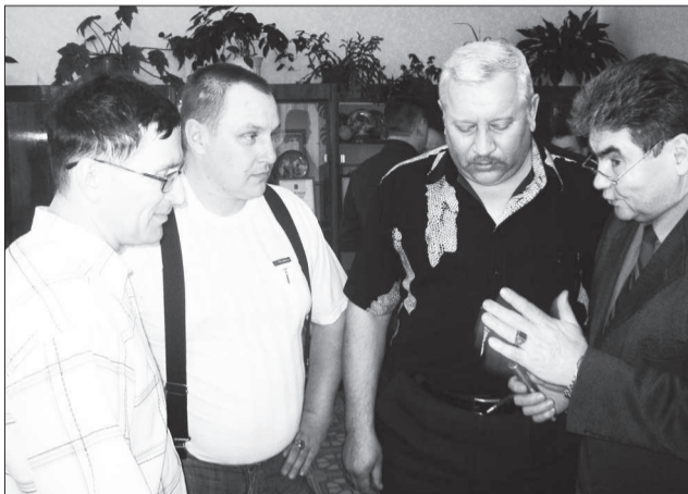
Порядка душа требует.

Девять исовчан стали народными дружинниками