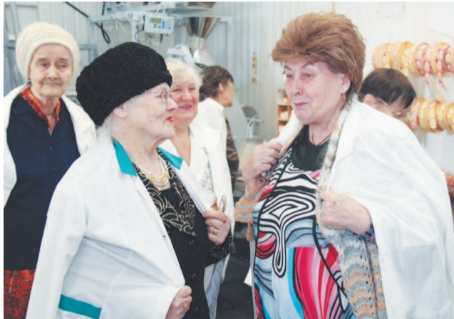
Приятно вновь пройти по цехам.