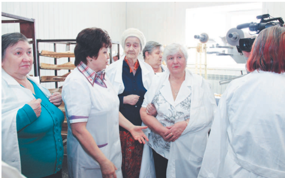
Все изменилось - только в лучшую сторону.