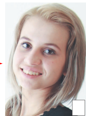
Подготовил Сергей ФЕДОРОВ.

Для нее конкурс — это возможность проверить свои способности. Ее девиз: «Верь в себя, и мечты сбудутся!»