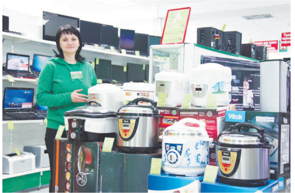
Спасет от плиты мультиварка.