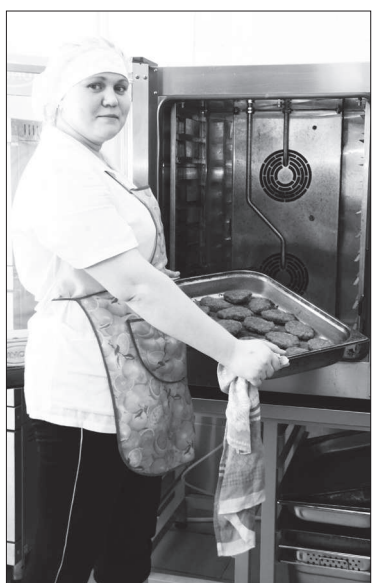
Здоровая пища из пароконвектомата.