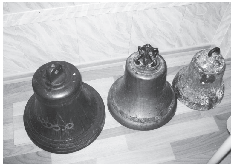
Колокола для звонницы подарили железнодорожники.

ховные принципы и ценности, которые закладывались тысячелетиями в нашем государстве, обществе. Вот вам и спиленные кресты, и разбитые иконы, и пляски в Храме Христа Спасителя, месте, откуда во время литургии как раз и открывается тот самый портал связи человека и Бога, дается мудрость и терпение человеку, приходит помощь. Все ведь более глубинно, чем мы себе представляем.