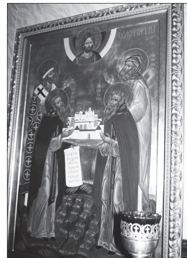
Иконы — самая большая ценность прихода.

— Вы знаете, я никак не могу согласиться с тем, что наши чиновники стали вдруг воспринимать храмы частью своих социальных учреждений, поскольку тут всегда накормят, обуют, обогреют. Да, это так. Но это было во все времена, еще до появления социальных служб в городских муниципалитетах. Но при этом