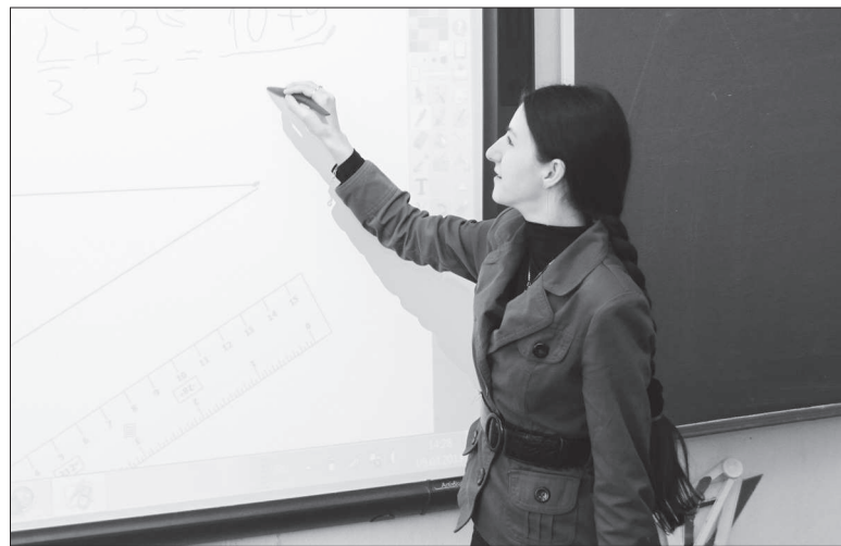
Работать с интерактивной доской одно удовольствие.

В конце прошлого года в одном из интервью начальник Управления образования Нижнетуринского городского округа отметил, что наш округ выполнил задачу Министерства образования