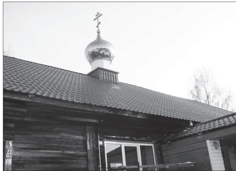
«Купола в России кроют чистым золотом, чтобы чаще Господь замечал...»

Отцы пустынноики и жены непорочны, Чтоб сердцем возлетать во области заочны, Чтоб укреплять его средь дольных бурь и битв, Сложили множество божественных молитв... А.С.Пушкин.