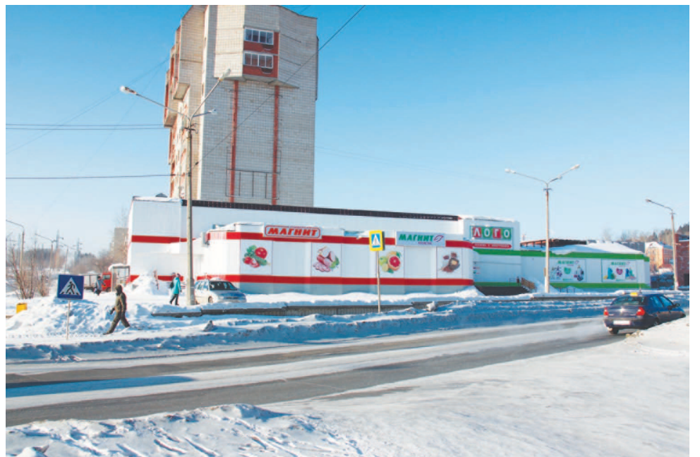
«ЛОГО» «поселился» на ул. 40 лет Октября, 10а.

Что подарить любимой на 8 Марта? Ответ на этот вопрос можно найти в техномаркете «ЛОГО», который основательно пополнил ассортимент товаров, чтобы ваши весенние подарки получились отличными. На полках популярного в народе маркета покупателей ждут СВЧ-печи, пылесосы, кухонные комбайны, блендеры, фены, утюги и парогенераторы, чайники, кофеварки и соковыжималки. В торговом зале дружными рядами выстроились холодильники, многофункциональные стиральные машины, суперсовременные LED телевизоры.