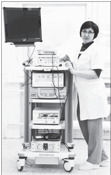
На помощь врачам пришла электроника.