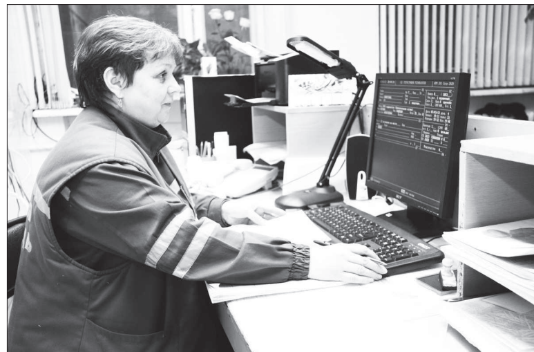
Работу скорой помощи контролирует компьютер.