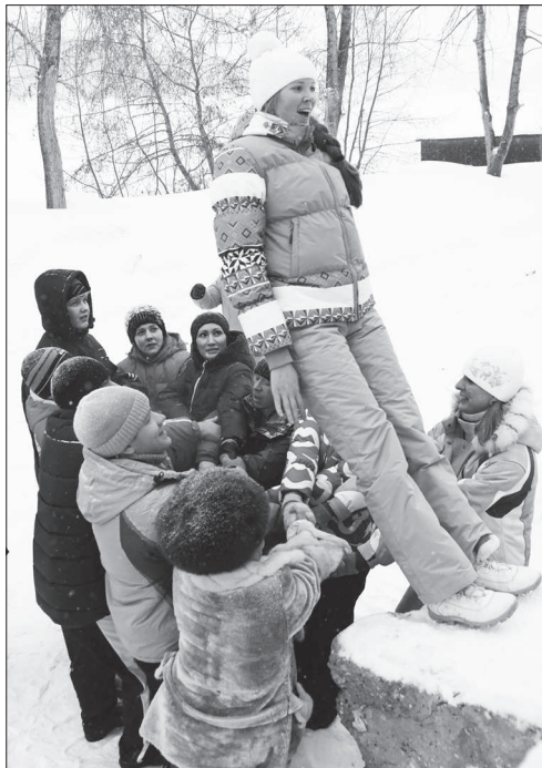
Ловите меня, друзья!

В ЭТОМ году нижнетуринцам предстоит принять участие сразу в двух избирательных кампаниях. Совсем скоро, в конце марта, состоятся дополнительные выборы депутата Законодательного Собрания Свердловской области. А осенью нам предстоит решить, кто будет руководить Нижнетуринским городским округом следующие пять лет.