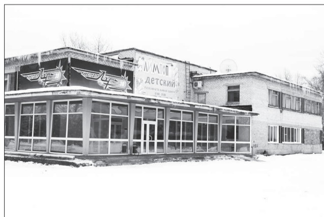
Досуговый центр стал 3D кинотеатром.