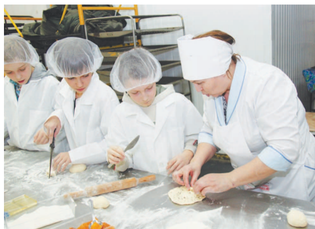
Делай, как я!

Визит к хлебопекам дал подросткам знание того, как получается тесто, а из него — хлебобулочные изделия, какие машины помогают пекарям в работе, что должно случиться с тестом прежде, чем оно станет румяным караваем. Пятиклассники получили опыт работы с тестом и остались очень довольны результатом. На себе прочувствовав, как не прост труд пекаря, они с гордостью принесли домой изготовленные своими руками булочки. Впечатления, получен-