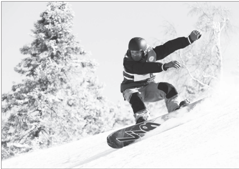
Сноуборд получил на Урале официальное признание.

В четверг и пятницу на горе Белой состязались учащиеся детских спортивных школ, а в субботу и воскресенье на старт вышли любители и ветераны горнолыжного спорта. Сноубордисты показывали свое мастерство в слоупстайле (серии акробатических прыжков) и биг-эйре (прыжки с большого трамплина, с выполнением в полете различных трюков). Горнолыжники мерялись силами в гигантском слаломе и специальном слаломе. Были красивые полеты и эф-