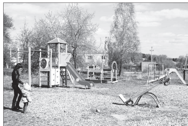
В округе появилось 10 детских площадок.