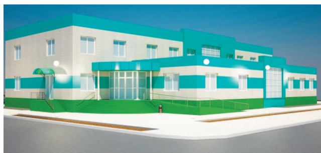
Проект внешнего вида гемодиализного центра.