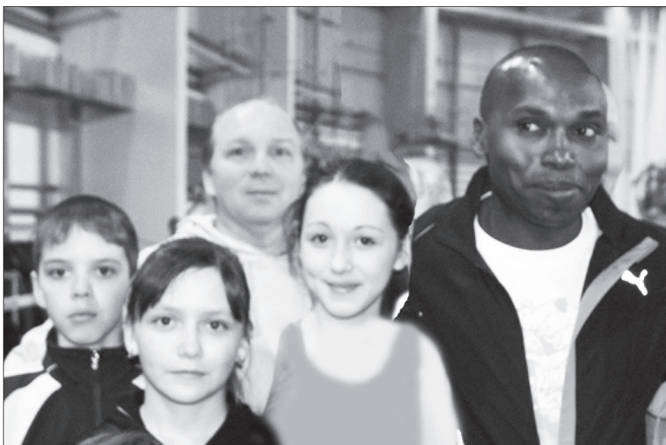
Нижнетуринские легкоатлеты на встрече с рекордсменом мира Уилсоном Кипкетером.

В КОНЦЕ марта в Казани прошли традиционные финальные Всероссийские соревнования по легкой атлетике «Шиповка юных», собравшие сильнейших спортсменов раз-