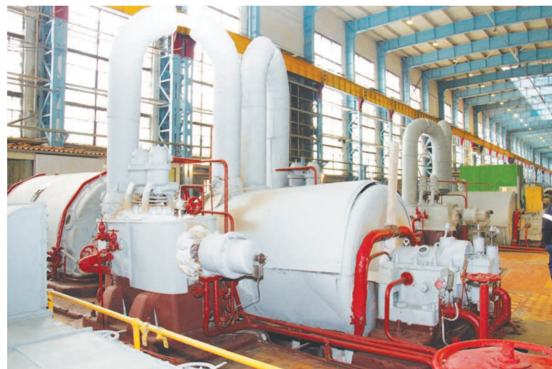
Раритетные немецкие турбины все еще в строю.

Половина стройплощадки уже засыпана внушительным слоем щебня, для площадки главного корпуса его потребовалось свыше 48 тыс. куб.м. Работы по отсыпке площадки производит «Монтажное управление №5» (г. Москва), на данный момент уже отсыпано 70% требуемой площади. Для новой станции котлован копать не будут. Совсем скоро из Белоруссии (фирма «Дельта», г. Гомель) придут огромные буровые установки, с помощью которых изготовят буронабивные сваи. Под фундамент главного корпуса потребуются установить 670 свай глубиной до 20 метров и диаметром до 800 мм. А всего для новой станции будет заложено более полутора тысяч свай различного размера. Учитывая важность фундамента, строители сначала изго-