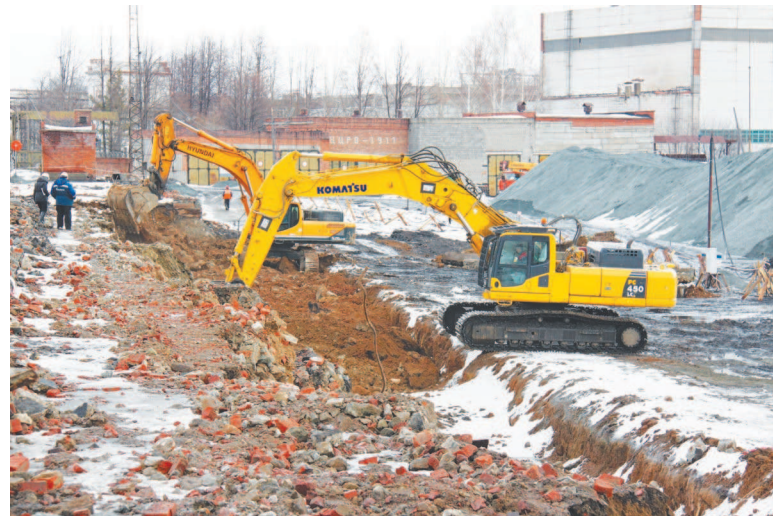
Производится демонтаж старых фундаментов.

товят опытный образец сваи и испытают его различными нагрузками до полного разрушения. Полученные данные позволят проектной организации учесть все нюансы строительства на уральской земле, вплоть до применяемых марок бетона и арматуры.