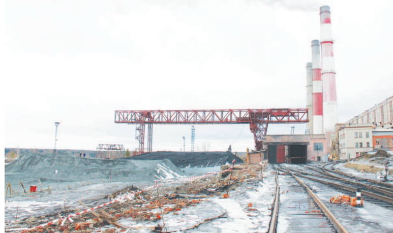
Стройплощадка потеснила угольный склад.