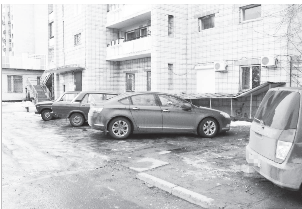
Тротуар и газон разрушены колесами автомобилей.

С ПРИХОДОМ весны обострилась проблема беспорядочной парков-