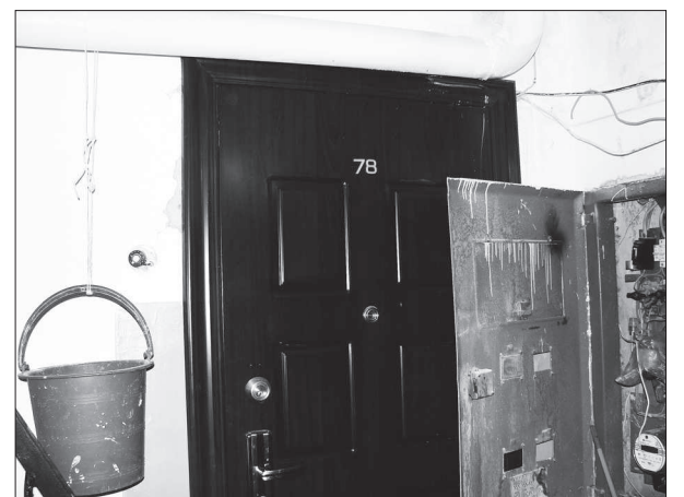
Вода электричеству не сосед.