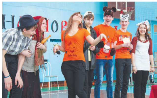
«Колобок» от «Кексиков».