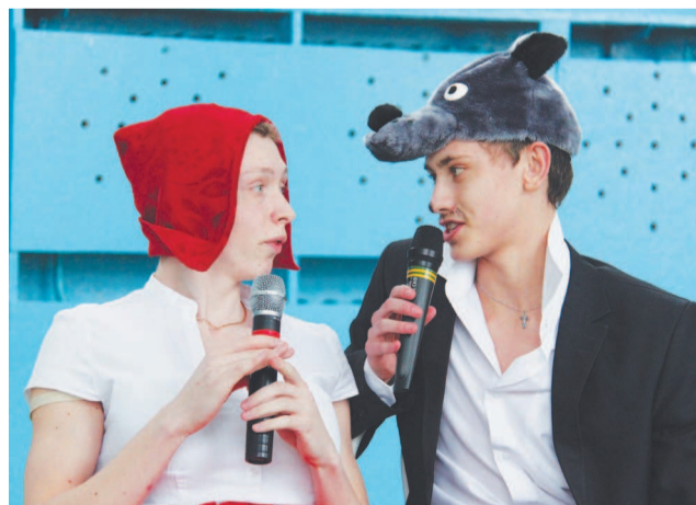
«Криминальная» парочка: Красная шапка и волк.