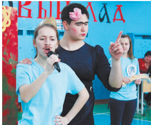
Принцессу - в жены за лаваш.