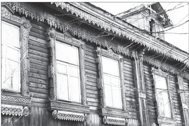
Особняка купеческой династии Задворных уже нет.

18 апреля — Международный день памятников и исторических мест