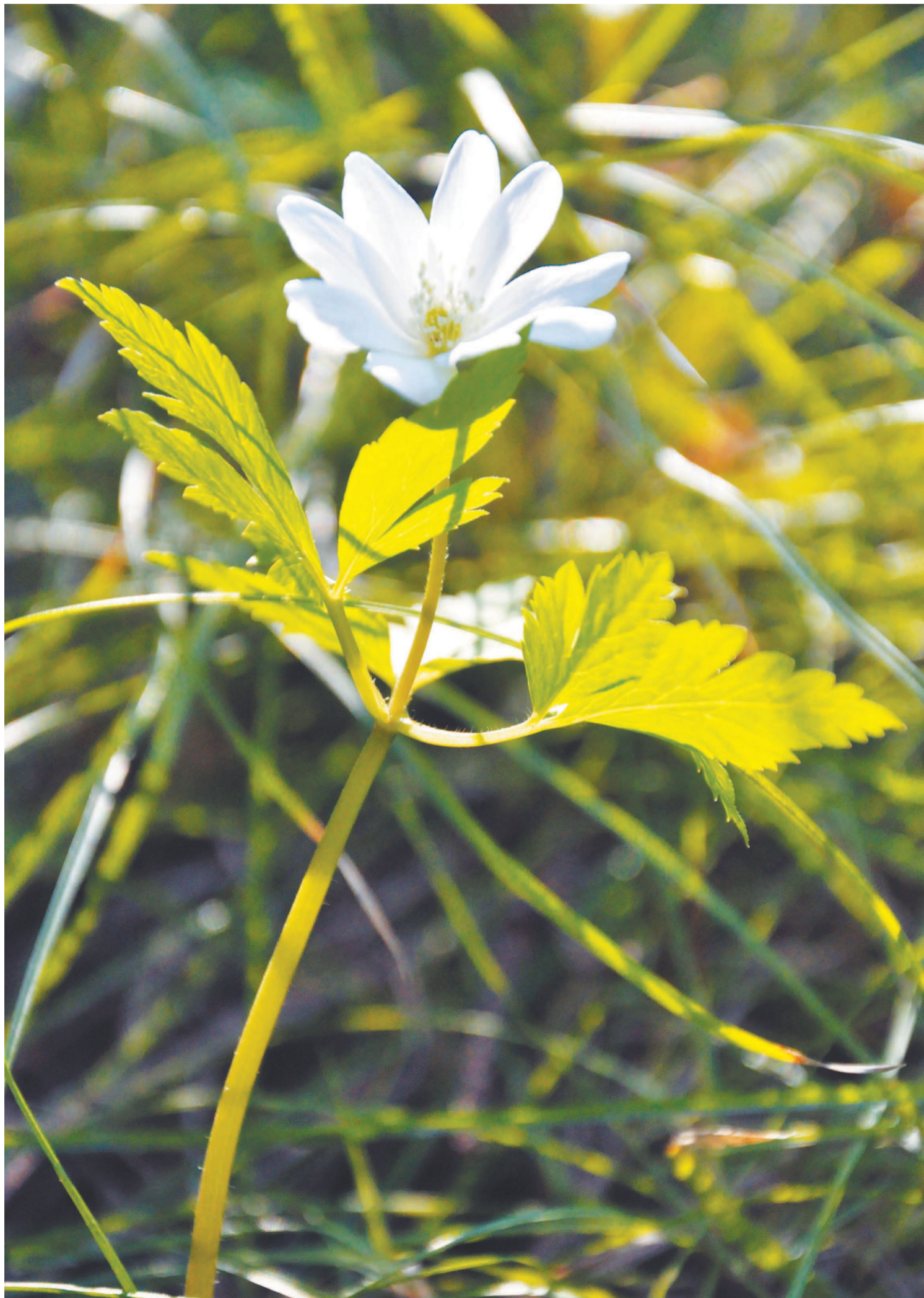
И у подснежника есть Международный день: 19 апреля.

Подготовила к печати Наталья КОЛПАКОВА.