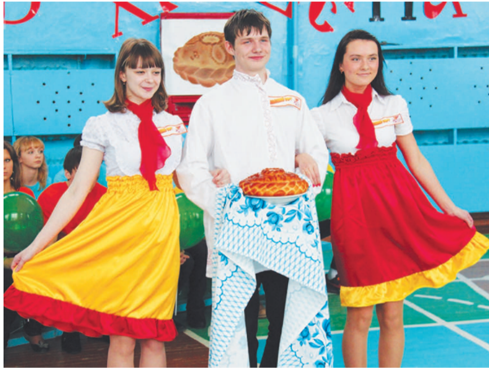
С хлебом-солью - «Высший сорт».

«Высший сорт» предложили залу посмотреть новую постановку «Красной шапочки», в которой юная обладательница броского головного убора пошла по узкой дорожке, превратив сказку в криминальное чтиво, но ко- нец истории, несмотря