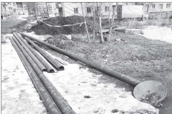
Бесхозные железяки ждут хозяина.