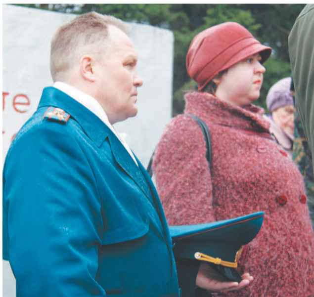
В скорби постоем и помолчим.