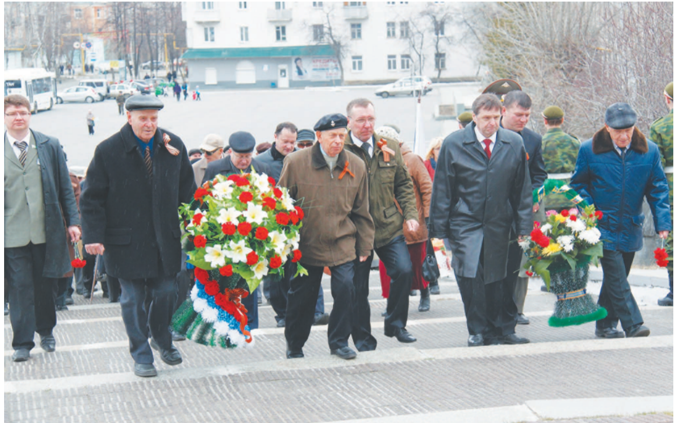
К ногам солдата.