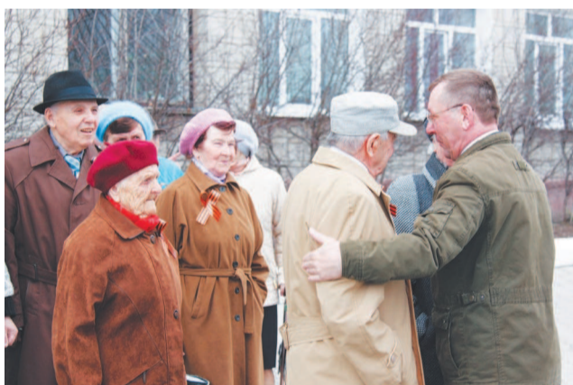
За мир благодарим.