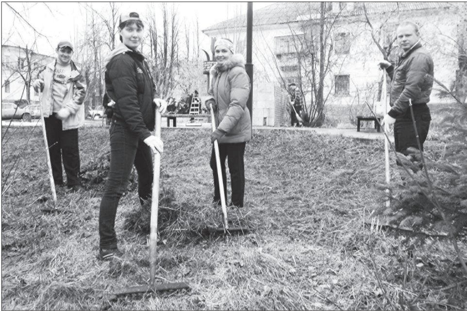
Активисты Молодежного совета очистили от мусора территорию памятника.

ТРАДИЦИЯ проведения весенних субботников зародилась в Молодежном совете при главе Нижнетуринского городского округа в момент его основания.