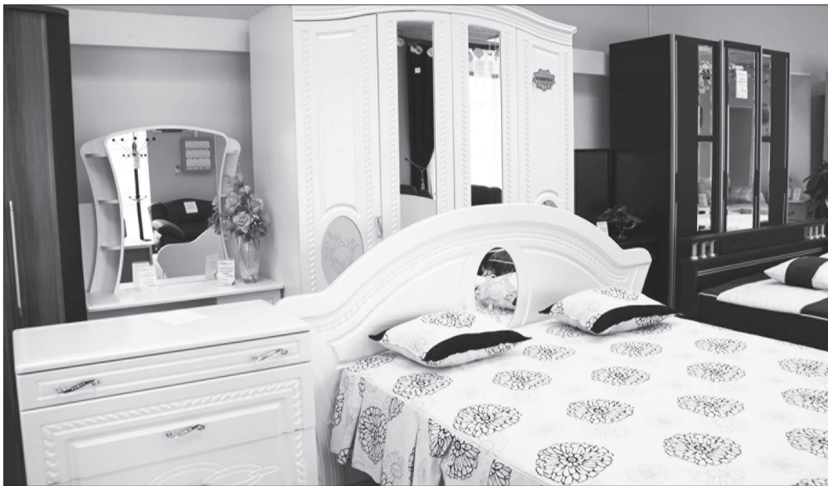
Спальня-мечта восстановит силы.

СПАЛЬНЯ. Согласитесь, для любого из нас это место особое, можно даже сказать – сакральное. Это место, где мы восстанавливаем силы, потраченные за день, полноценно отдыхаем. Ее спокойная аура обволакивает нас в течение ночи, отменяя тяжелые мысли, а удобная кровать полностью расслабляет уставший за день позвоночник, наполняя тело энергией. Если нам комфортно, если в комнате уютно и мило, то мы