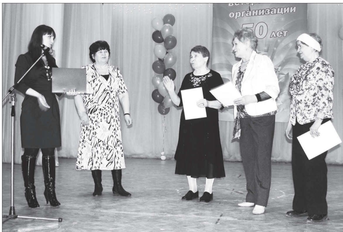
Профком ОАО «Вента» награждает активистов ветеранского движения.

С золотым юбилеем ветеранов-общественников поздравляли также Молодежный совет при главе НТГО, представители партии «Единая Россия». Поднявшись на сцену, председатель местного от-