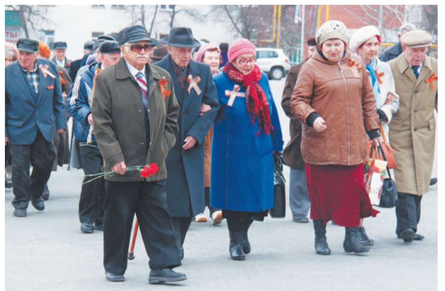
Идем туда, где пламя трепетно горит.