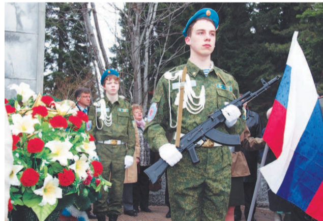
Неугасима память поколений.