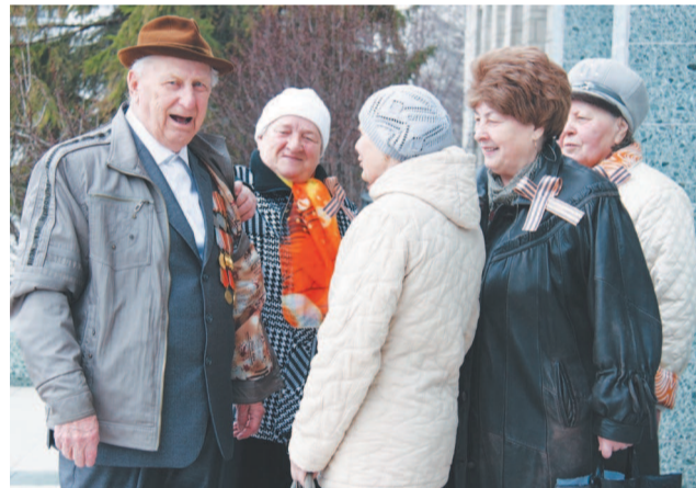
Носите ордена, в них теплятся рассветы, что отстояли вы.