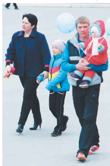
Семье Воробьевых память этот день.