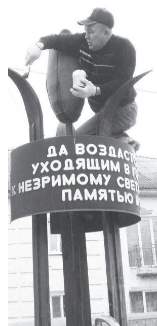
Ветераны боевых действий спасали «Черный тюльпан» от ржавчины.

Трудовые силы Молодежного совета при главе НТГО и ветеранов боевых действий в Афганистане и Чечне были брошены на уборку памятника «Черный тюльпан».