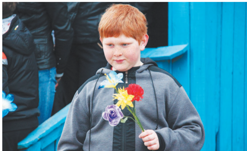
Чтобы юные знали, помнили, чттили.