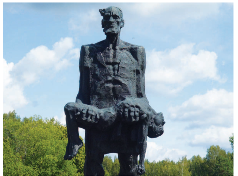
Хатынь. «Непокоренный человек».