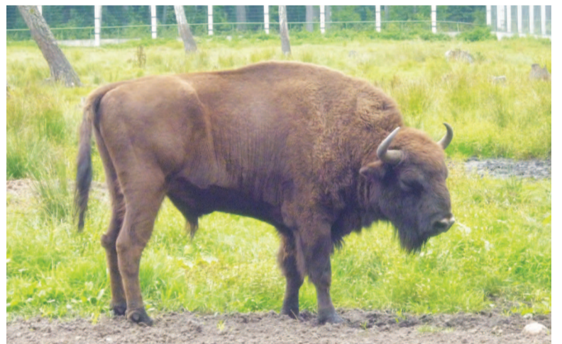
Родословной зубра — тысяча лет.

Главная пища зубров — растения. Но сотрудники заповедника, чтобы сохранить популяцию, подкармливают их еще и зерном, сеном, подсеивают им бобовые культуры, люпин. Ослабленные животные и маленькие зубрята живут в вольерах. Общаться с ними — одно удовольствие. Доверчивые телятки протягивают сквозь решетки свои шершавые языки и осторожно берут с рук посетителей всякие вкусности. Здесь же содержатся кабанчики, тарпановидные лошади.