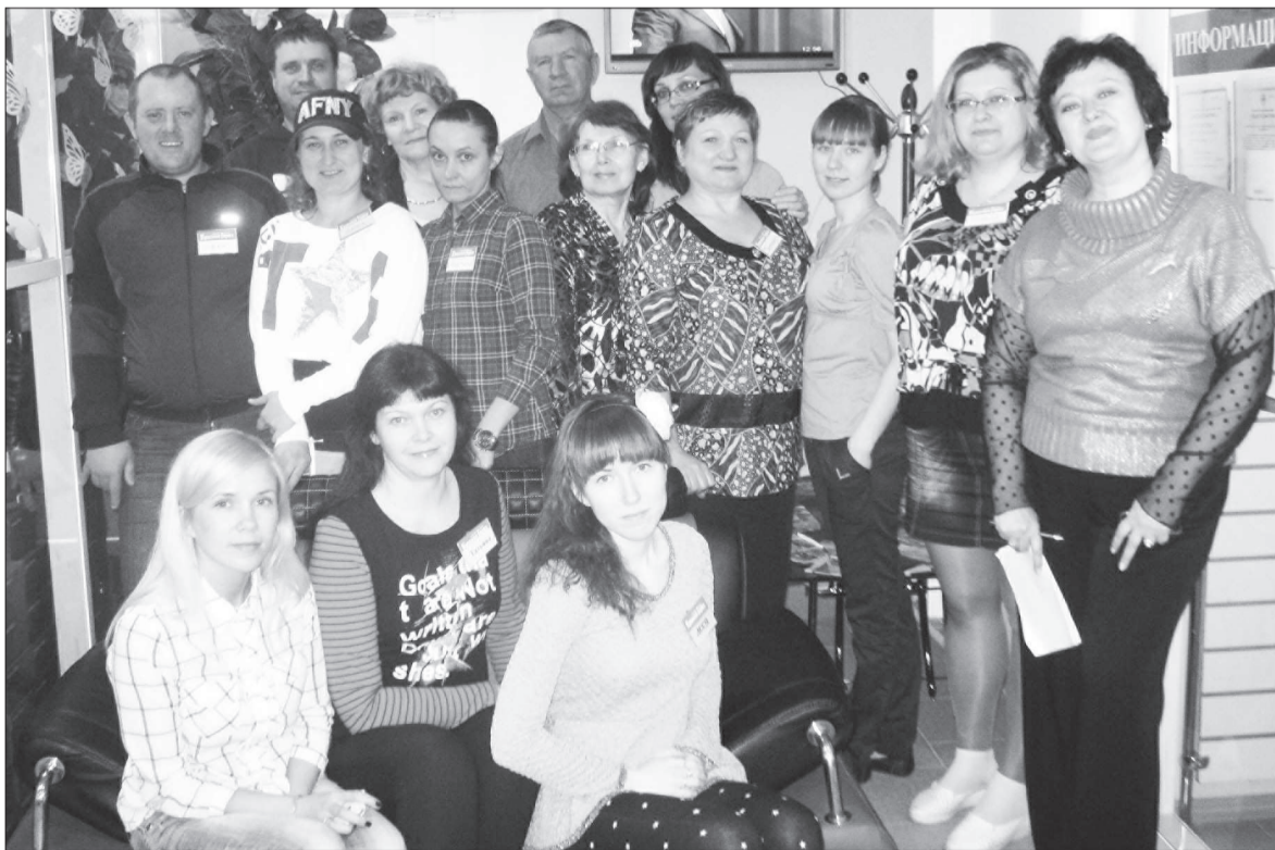
Арендаторы торгового центра «Красная горка».