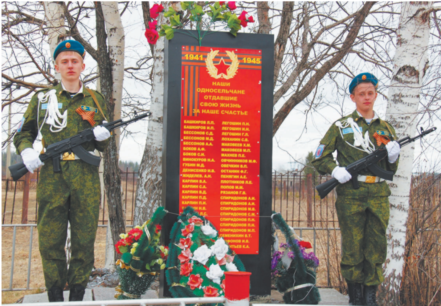
В Новой Туре - новая стела.

P.S. Автопробег осуществлялся на средства администрации НТГО, местного отделения ДОСААФ России, местного отделения ВПП «Единая Россия», ИГРТ.