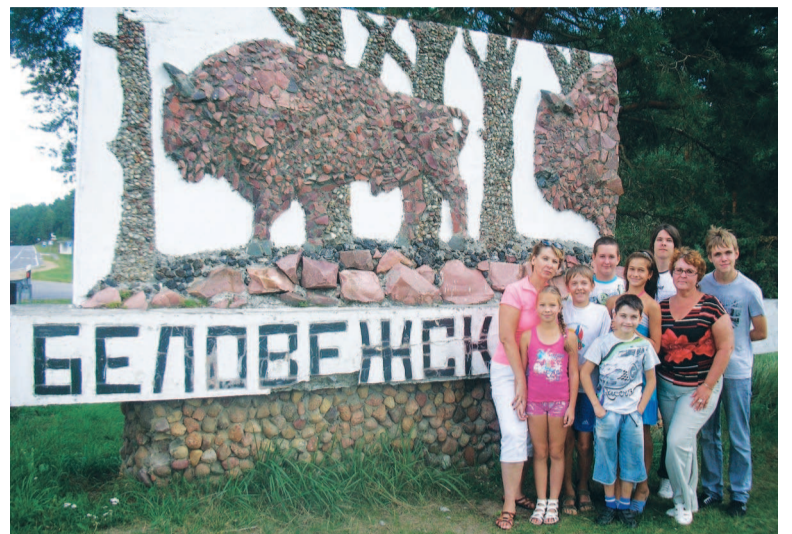
Мы были в Белоруссии.

Когда наступил ледниковый период, бизоны (предки зубров) прошли за тысячи лет громадную территорию, видоизменяясь и эволюционируя.