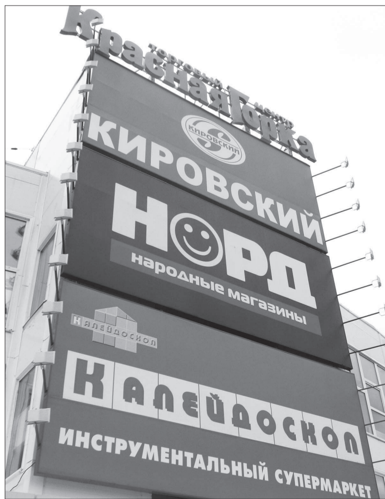
Красивый, вместительный, современный, необходимый!

Мы ждем вас 12 мая в 12 часов на площади у «Красной горки»!