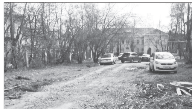
«Деревья, как сейчас? Или приличная парковка, как хотелось бы?»