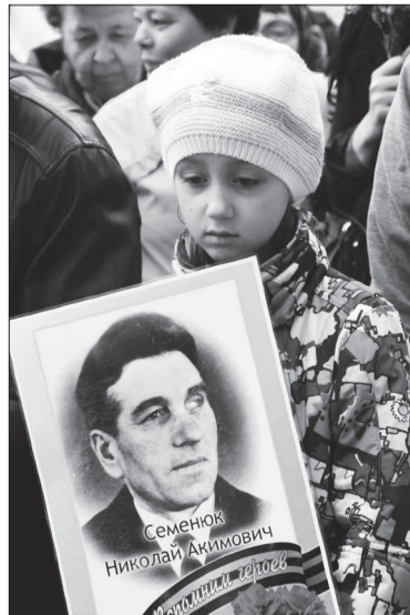
Будем помнить героев!