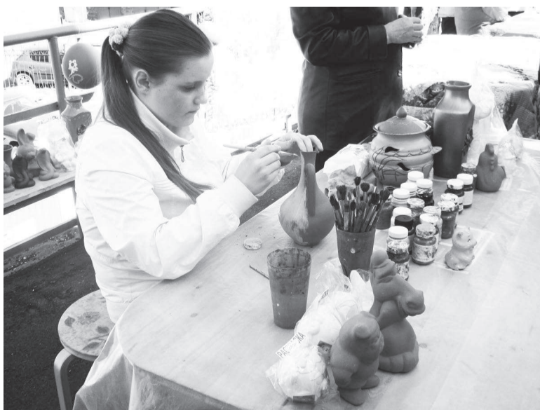
Приглашаем к творчеству.

ВОСКРЕСНЫЙ день 12 мая был солнечным, но довольно прохладным и ветреным.