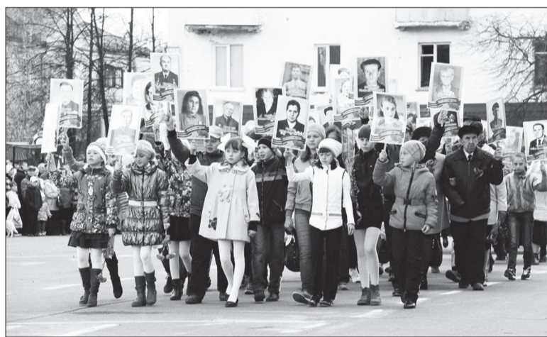
Участники акции «Вспомним героев» с фотографиями родных и близких.