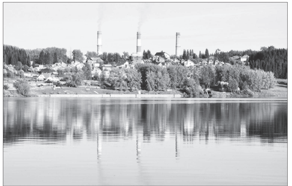
Как хороши окрестности Туры!

Отдельно хочется сказать об организованном нами военно-патриотическом маршруте для школьников, позволяющем сердцем прикоснуться к городским реликвиям и их истории: мемориалу, возведенному в честь погибших в годы Великой Отечественной войны, памятнику жертвам современных локальных войн «Черный тюльпан». Рассказ бывшего директора завода