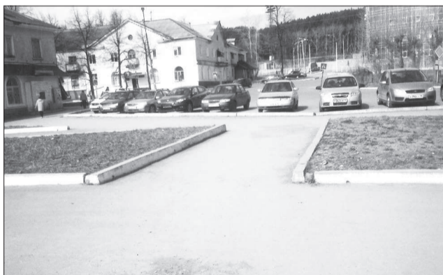
«Клумбы можно потеснить».

ВОЗЛЕ Детской школы искусств есть небольшая площадка для парковки машин. Рядом разбиты клумбы, цветники радуют глаз до поздней осени. Красиво, не спорю, но лично меня больше волнует практическая сторона вопроса. Стоянка очень маленькая, тем более для этого, центрального, района, единственный способ ее расширить — убрать клумбы. Точнее, не убирать, а разбить их в другом месте, где-нибудь поблизости.