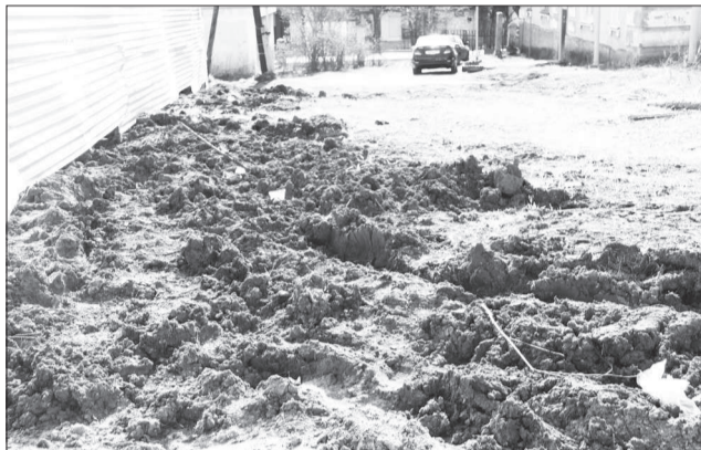
А пока обувь пешеходов принимает грязевые «ванны»...