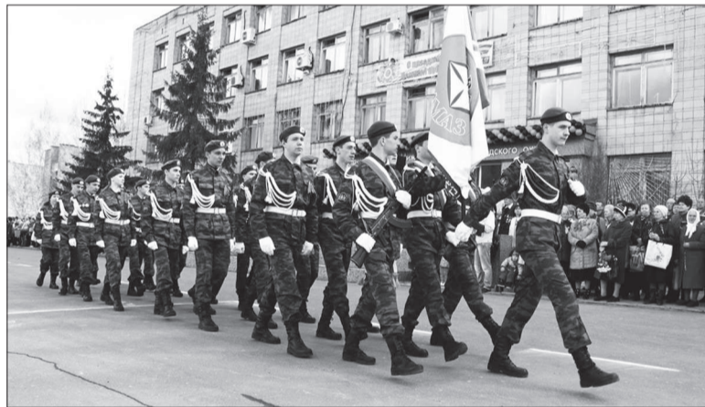
Военно-патриотический клуб «Алмаз».