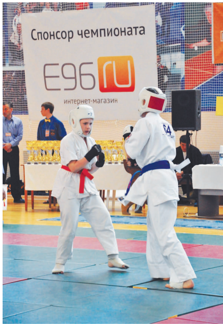
На первенство по кумитэ Кекусин карате в Нижнюю Тору приехали более 150 каратистов.