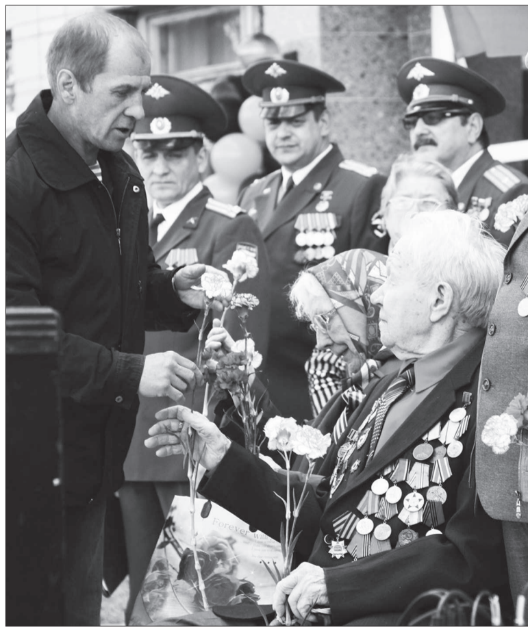
Благодарим за мирное небо!