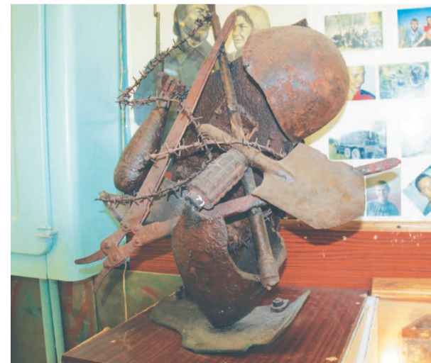
Экспозиция «Что пришлось на долю солдата Великой Отечественной».