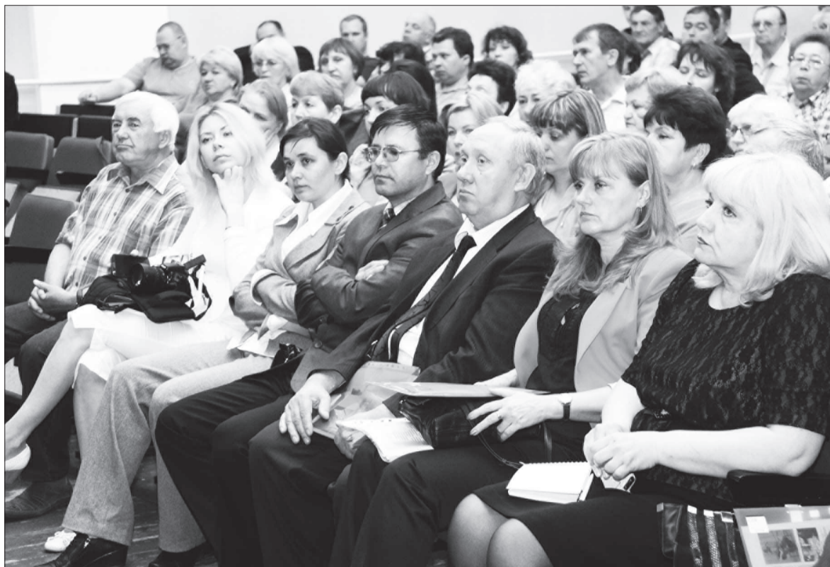
В обсуждении проекта реорганизации участвовали коллективы ПЛ-22 и ИГРТ.

СОБЫТИЕ, о котором многие долго боялись говорить вслух, свершилось. Министерство общего и профессионального образования Свердловской области приняло окончательное решение о присоединении профессионального лицея №22 к Исовскому геологоразведочному техникуму.