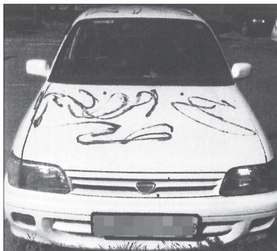
«Благодарность» в день неудачного экзамена.

СОВСЕМ недавно нижнетуринские школьники отпраздновали последний звонок. В тот день нарядные выпускники принесли своим учителям море цветов и добрых пожеланий. И не забыли старую добрую традицию — на дорожках у каждой школы написали десятки благодарных слов в адрес своих наставников.