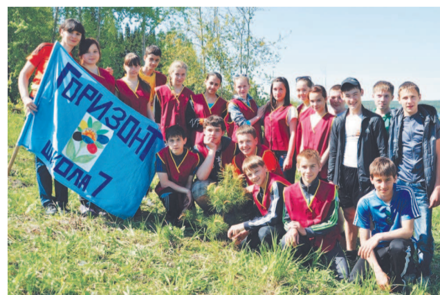
Трудовой отряд школы № 7.