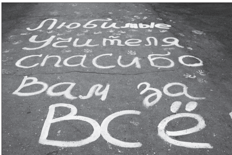
«Благодарность в день «Последнего звонка».