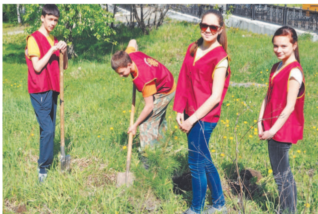
Парни работают, девчонки командуют.