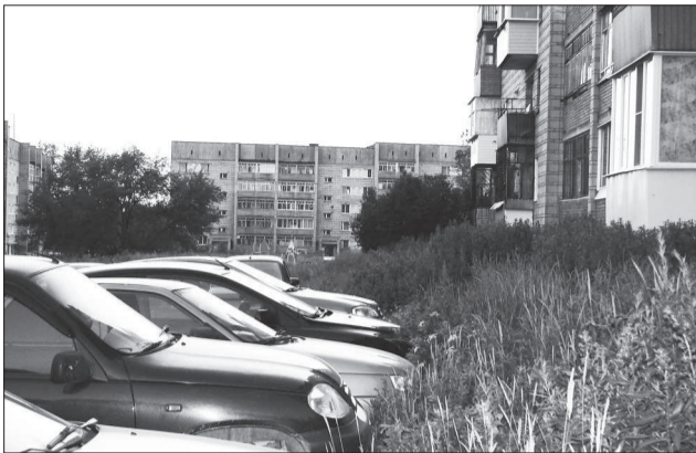
Десяти метров от балкона здесь нет.

ДВОР на ул. Говорова, 4 мал да тесен, не разыхаться в нем, не встать, вот и приспособились автовладельцы парковаться за домом под окнами. Приглянувшуюся территорию шебнем отсыпали. Удовлетворив свои потребности, водители не учли интересы тех, чьи окна и балконы оказались в недопустимой близости от машин.