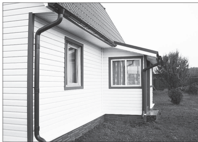
Сайдинг придает дому современный вид.

Кстати, жителям многоквартирных домов сайдинг также может пригодиться. Например, для облицовки балконов или лоджий.