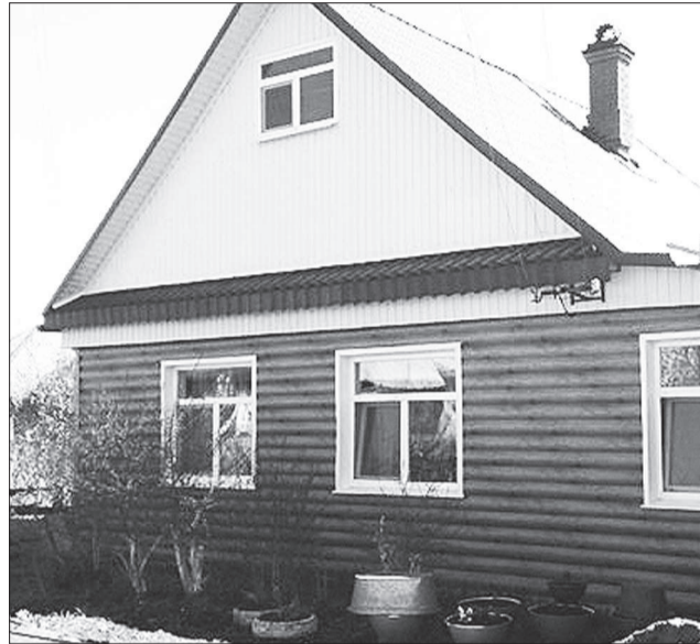
Отделка дома сайдингом - легко и просто.

- Конечно! Есть немало примеров, когда благодаря использованию сайдинга невзрачные и уже много лет послужившие дома обретали вторую молодость. Кроме того, за счет утепления стен попутно повышается энергоэффективность этих домов.