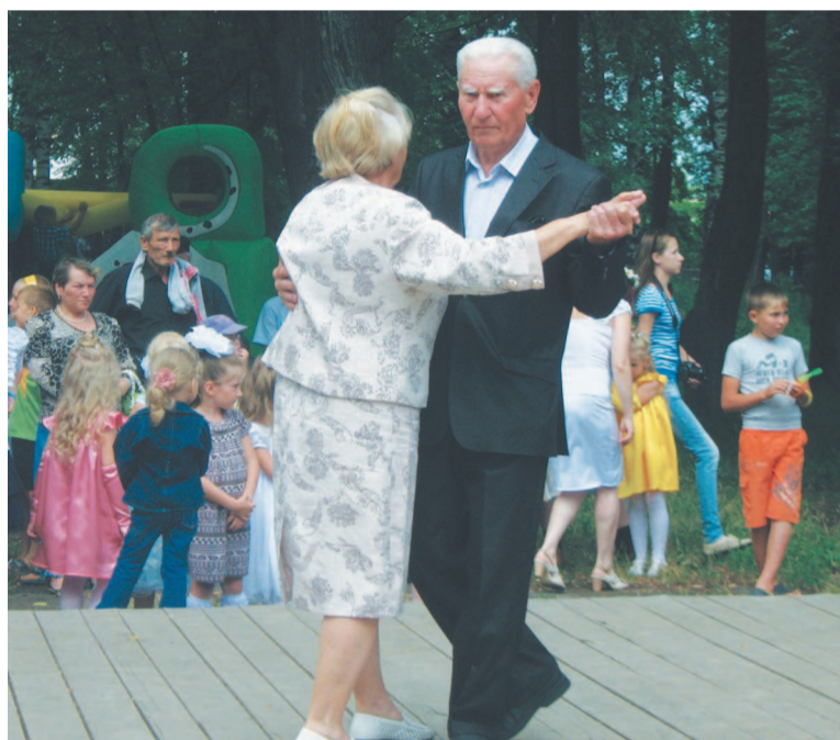
Тур вальса - спустя полвека.