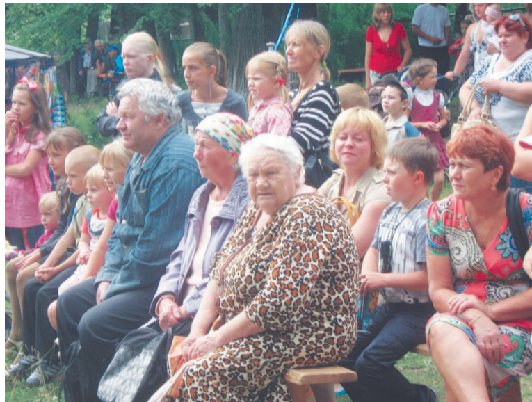
Пришли на праздник и стар, и млад.

рублей. Победителей и всех участников эстафеты ждали еще и сладкие призы от Нижнетуринского хлебокомбината — вкусные торты.