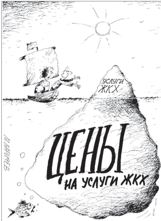
Карикатура с сайта http://caricatura.ru .

ЕЩЕ не остыли воспоминания о коммунальных штормах, сотрясавших Нижнюю Туру год назад. Тогда волны народного негодования тшетно бились об скалу, бесполезно занывшую в нашей тихой гавани слишком много места. Имя той огромной «скале» - ООО «Нижнетуринская жилищная компания» или, короче говоря, управляющая компания ООО «НТЖК».