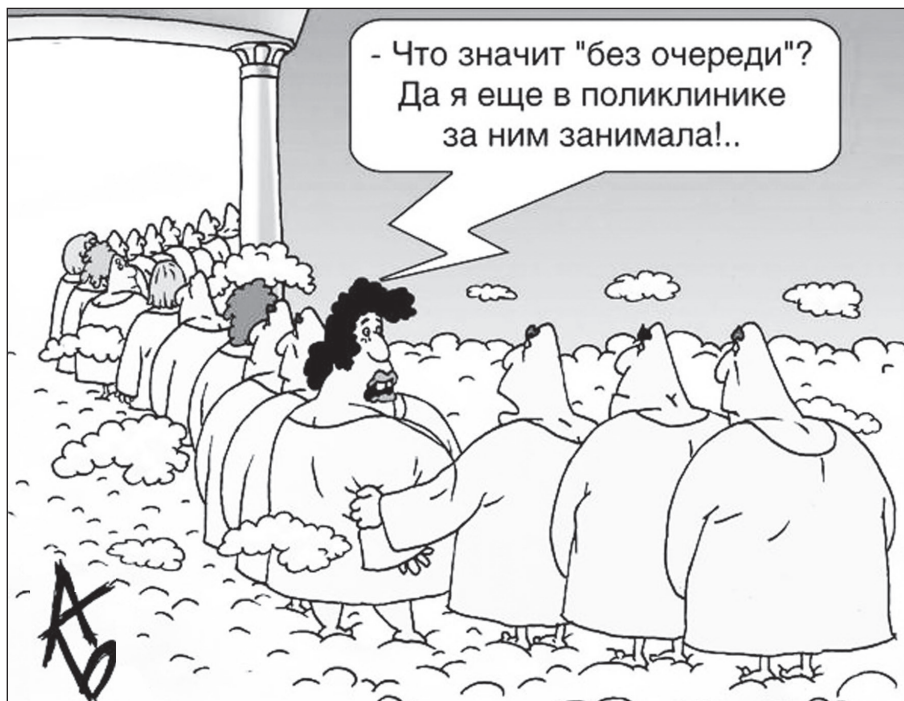
Карикатура с сайта http://caricatura.ru .

Решением суда договор аренды данного земельного участка был расторгнут. В настоящее время индивидуальный предприниматель пытается оспорить это решение.