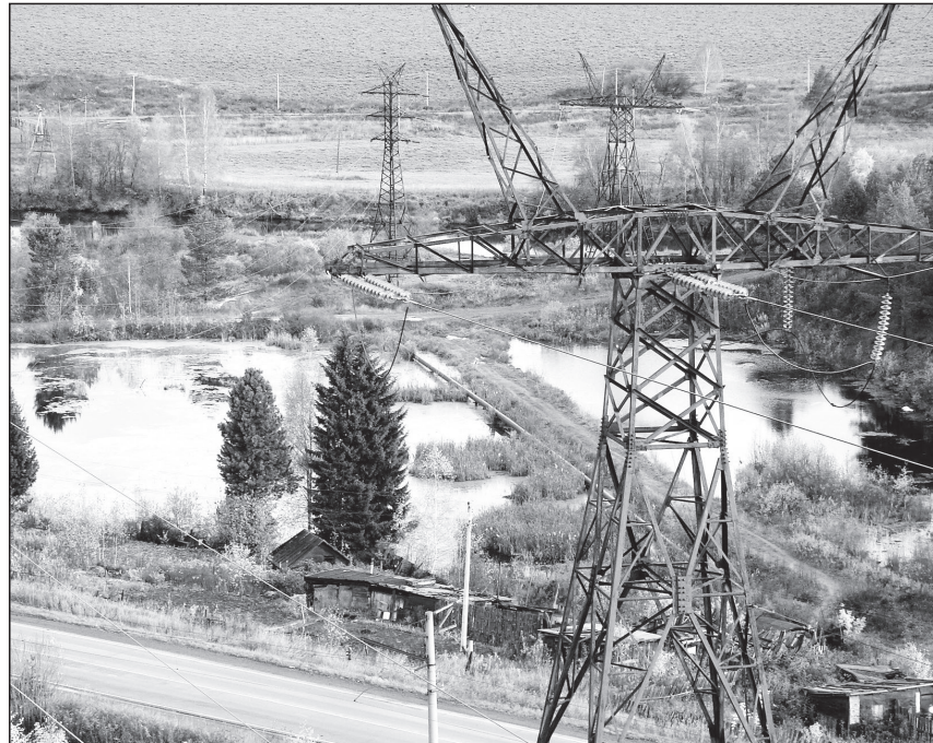
Жильцы считают, что напасть летит отсюда.

Источник размножения мух в доме не найден, жители предполагают, что мушиный рассадник