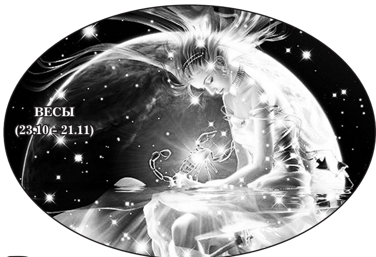
ВЕСЫ (23.10 - 21.11)