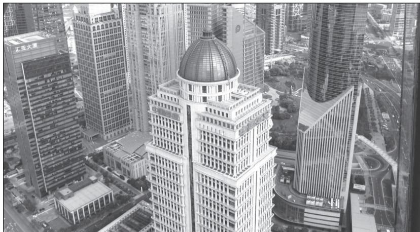
Китай: необычные формы зданий. Высокие жилые дома.

Приехал в гостиницу. Разместился, помылся и немного отдохнул. Связался с родными по скайпу. Пошел на разведку, погулять по улице. Это был один из центральных районов. Перед моим взором предстал такой город, какой обычно показывают в фантастических фильмах: необычные формы зданий, высокие жилые дома. На улицах чистота. Прогулялся в одну сторону, потом в другую. Проголодался. Надо перекусить, но где это сделать? Пойти в «Макдональдс»? Но обычно я не питаюсь в таких местах, но тут выбора не было: китайский не знаю, английский тоже. Захожу, отстояю очередь. Беру меню, показываю вот это и вот это. И тут начинаются вопросы, понятия не имею, что говорят. Жестами пытаюсь объяснить, что кушать хочется очень сильно. Очередь смотрит на меня, мне аж не по себе стало. После 20 минут мучений мне дали пакетик с бургером, картошкой и колбой. Если честно, редкостная гадость, ешь как будто бумагу жуешь. На этот день впечатлений было достаточно, и я ушел в гостиницу.