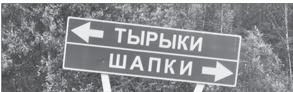
Таким соседям наверняка не скучно.