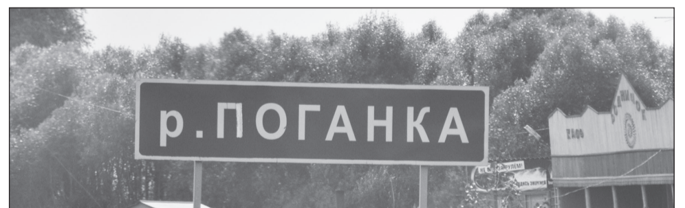
Кто сделал речушку такой?