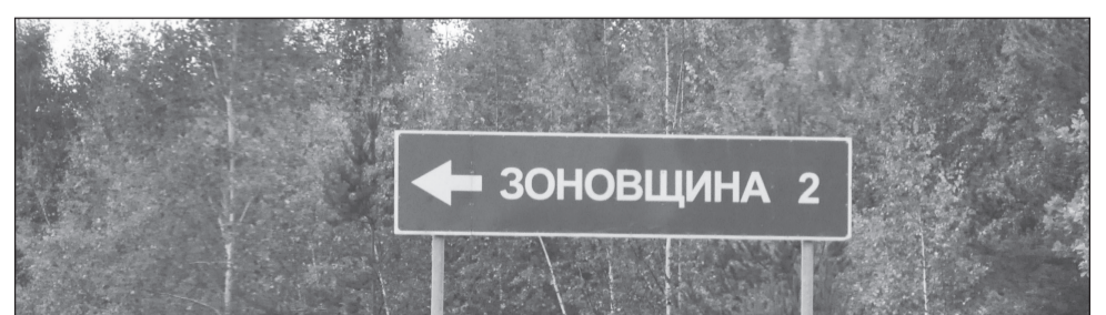
Хоть до Зоновщины рукой подать, но уж лучше вы к нам.