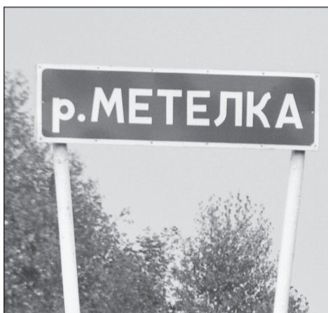
Ты мети меня река...