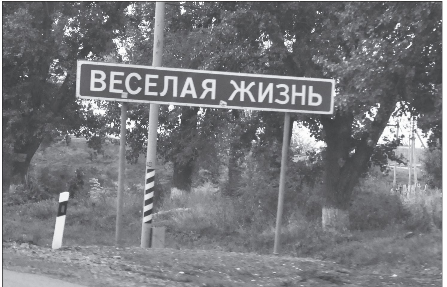
Стало грустно и ничего не радует? Поезжайте в Веселую Жизнь!