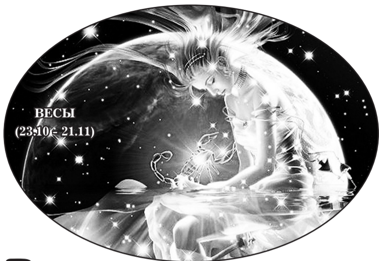
ВЕСЫ (23.10 - 21.11)