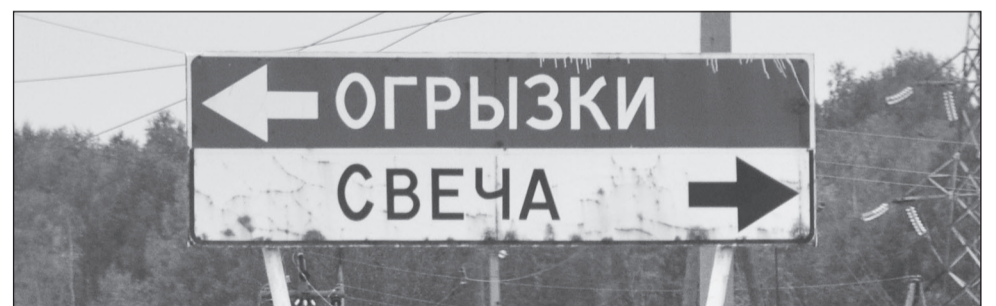
Любой богатырь призадумается на таком распутье.