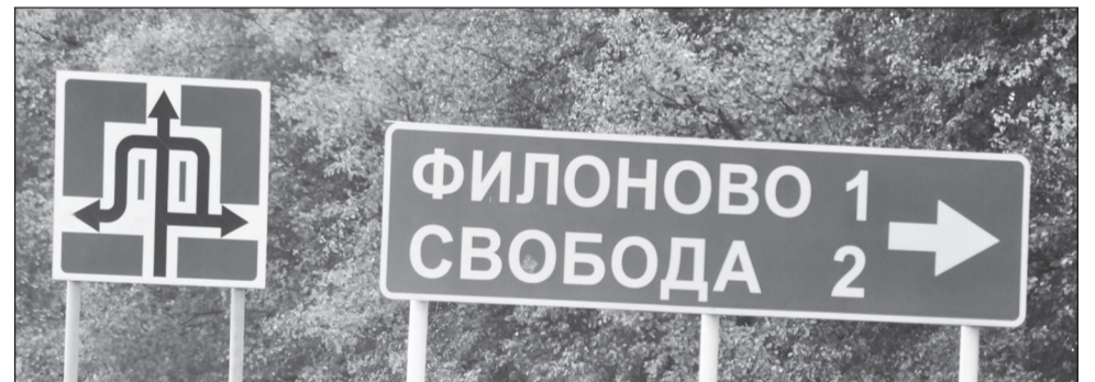
Эти края пропитаны духом свободы и праздника.