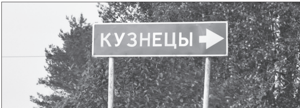
Здесь вам запросто коня и блоху подкуют.