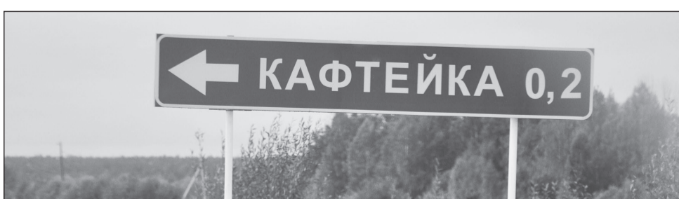
С таким названием не замерзнешь.