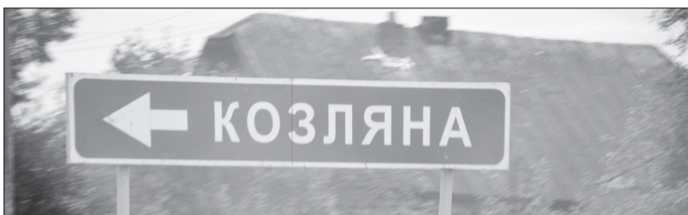
Кто за Козляну ответит?