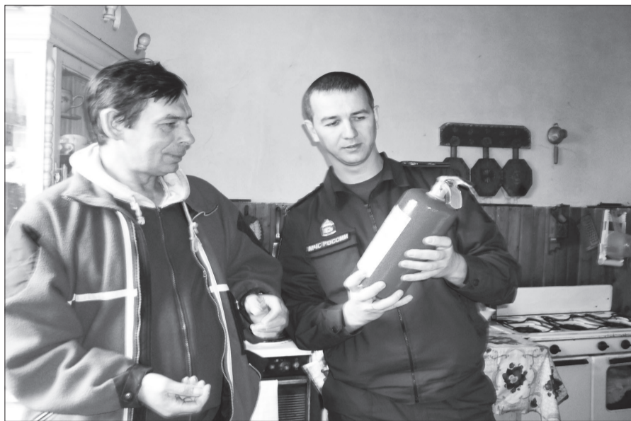
О правилах пользования средствами пожаротушения.

В отношении собственников жилья, нарушивших правила пожарной безопасности, возбуждены дела об административном правонарушении. Участники рейда напомнили жителям о мерах пожарной безопасности и как действовать в случае возгорания. Также проведены разъяснительные беседы о применении автономных пожарных извещателей и первичных средств пожаротушения и вручены памятки