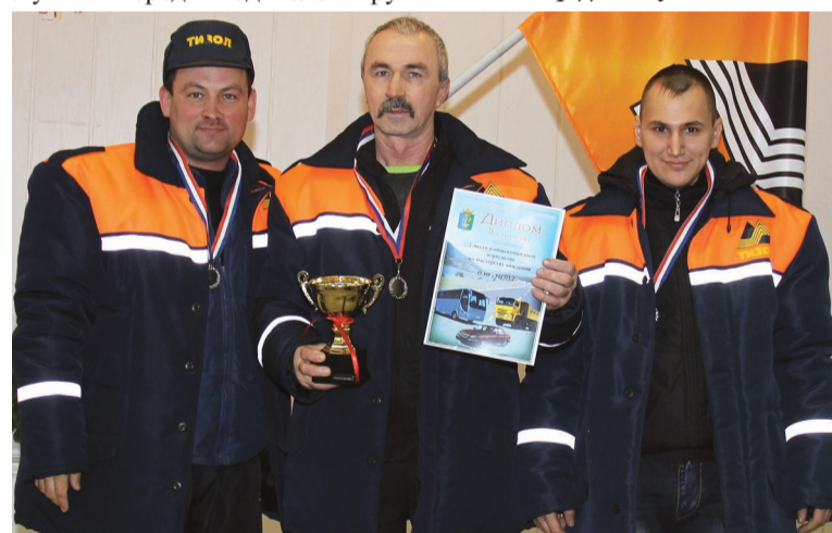
«Серебро» взяла команда ОАО «Тизол».