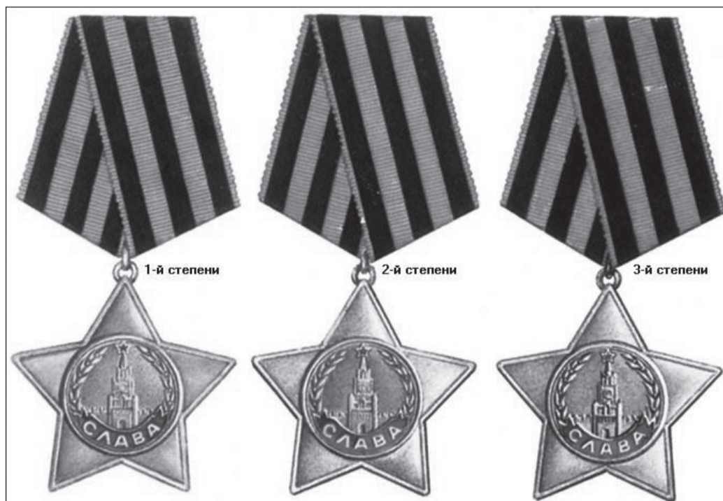
Знак ордена I степени изготовлен из золота. Знак ордена II степени - из серебра, а круг с изображением Кремля позолочен, орден III степени - серебряный.

По инф. Совета ветеранов. Из книги «Нижнетуринцы в боях за Родину».