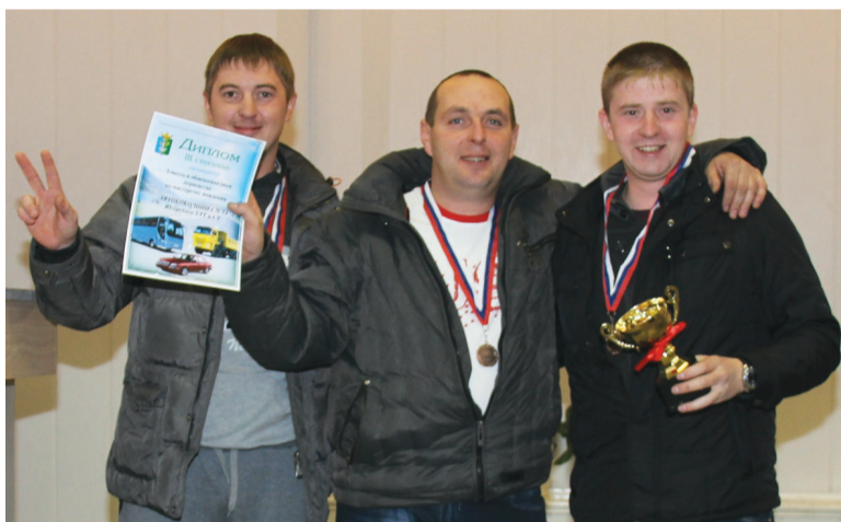
Бронзовый призер - команда а/к 14 ЮУТТиСТ.

Фоторепортаж размещен на сайте http://vremya-nt.ru .