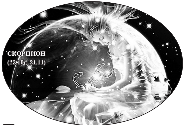
СКОРПИОН (23.10 - 21.11)