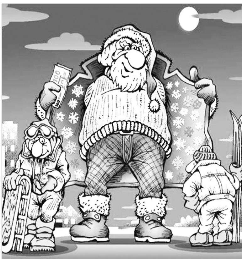
Иллюстрация с сайта caricatura.ru.