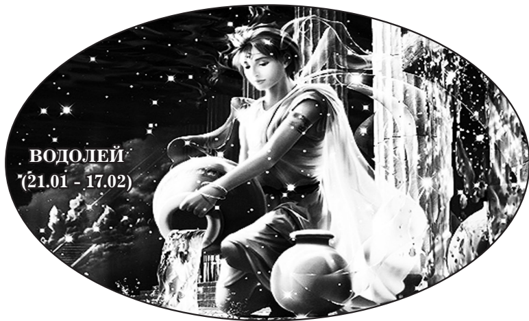
ВОДОЛЕЙ (21.01 - 17.02)