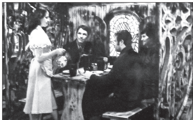
Резные детали интерьера и цветные витражи — визитная карточка кафе «Кедр».