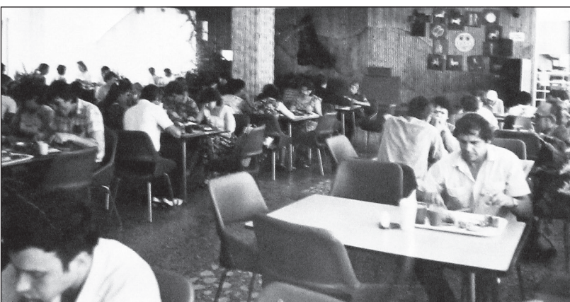
В столовой каждый день было многолюдно.

работали парикмахеры мужского и женского зала, часовая мастерская и фотомастерская. В просторных помещениях разместились два зала, каждый на три рабочих места. Впервые в новом доме быта нижнетуринские женщины могли воспользоваться услугой электрозавивки волос. В отличие от паровой завивки, занимавшей полчаса, электрозавивка длилась всего три минуты. В часовой мастерской, помимо ремонта часов, оказывались услуги по граверным работам. Первой заведующей домом быта была Софья Петровна Зыкова.