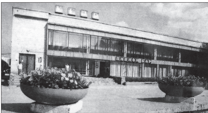
Благодаря широким окнам, залы «Кедра» всегда были полны света.

Выпуск газеты «Вперед, к коммунизму» от 31 июля 1971 г. рассказывал о работе комбината бытового обслуживания. На первом этаже